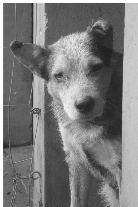
Figura 1. Cão doméstico, sem raça definida, adulto, infectado por Leishmania chagasi . Descamação furfurácea na ponte nasal. Lesões crostosas, rarefação pilosa e eritema nas extremidades dos pavilhões auriculares e na região periocular.

O encontro da LVC em Florianópolis estado de Santa Catarina gera grande preocupação, devido