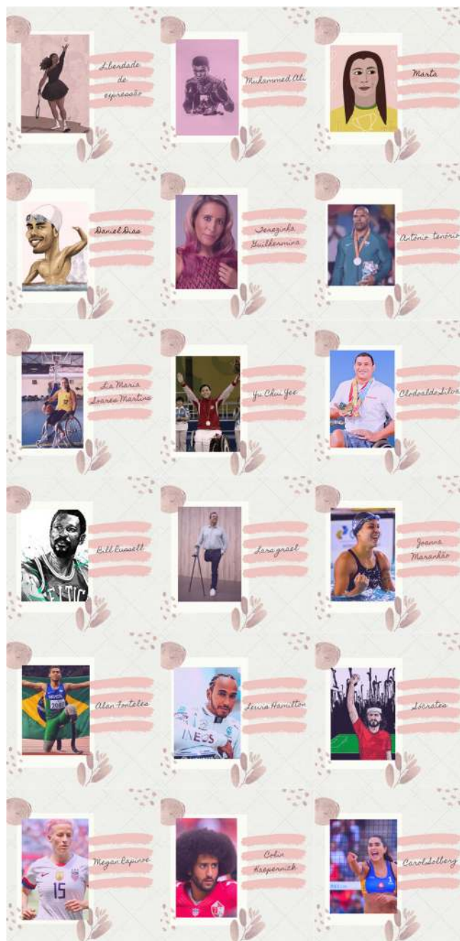
Figura 1. Praticantes de diversificadas manifestações da cultura corporal mencionados na exposição virtual.

Na Figura 1 será possível apreciar alguns dos praticantes de diversificadas manifestações da cultura corporal que foram mencionados nessa exposição virtual, destacando o movimento de luta que eles e elas realizam diariamente para combater as diversas formas de opressão que atravessam a sociedade.