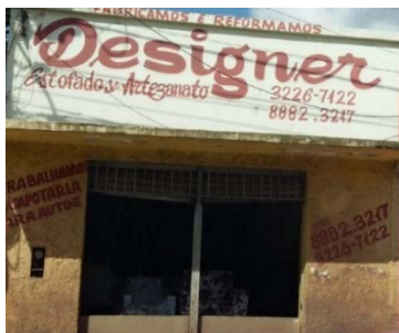
Figura 7: Loja de estofados e “artesanato”.

profissionais da área, o que faz o Design (FASCIONI, 2014). No caso da figura 7, a intenção do proprietário era utilizar a palavra como nome do empreendimento, tentando indicar a área que ele trabalha.