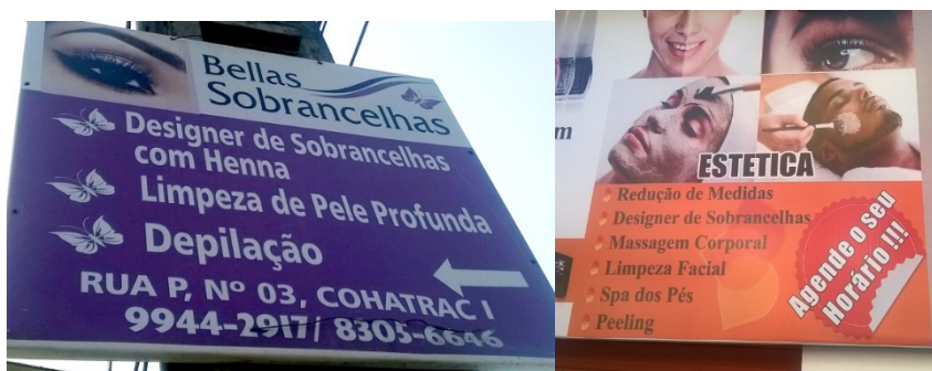
Figura 8: Serviços de design de sobrancelhas indicados em banners.

Outros exemplos, encontram-se na figura 8, portanto nestes casos, a palavra “designer” foi utilizada de forma errônea, quando o intuito seria indicar um serviço.