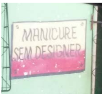
Figura 9: Comunicado e detalhamento de um serviço que não contém design em sua aplicação.

Para último exemplo, a figura 9 demonstra o uso da palavra como aparência, onde a manicure tenta comunicar o estilo do seu serviço que é de esmaltação simples, sem aplicação de desenhos e decorações. Observa-se novamente a associação popular do termo “design” como valor estético. Além disso, mais uma vez, têm-se a troca de “design” com “designer” (o profissional).