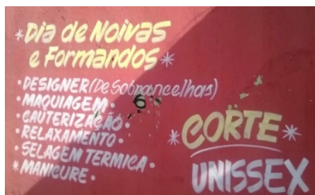
Figura 3: Exemplo do emprego da palavra design para o serviço de design de sobrancelhas. Elaborado pelo autor, com base na pesquisa realizada.

que para esta classificação, obteve-se apenas um registro do uso da palavra design para o profissional graduado da área.