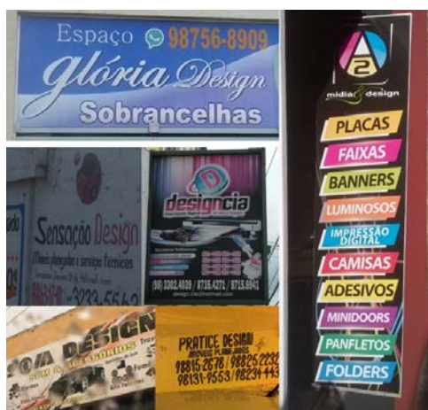
Figura 4: Exemplos de empreendimentos de diferentes ramos utilizando a palavra “design” em seus títulos. Elaborado pelos autores, com base na pesquisa realizada.

Design enquanto substantivo abstrato, a segunda classificação com maior frequência, obteve 39% dos registros. Portanto, o termo “design”, aqui, foi levado a outro patamar, visto que o seu uso popular e coloquial distorce os conceitos propostos por van der Linden et al (2014) em que, em São Luís, obtiveram-se exemplos concernentes a títulos dados a empreendimentos. Ao todo, 85,71% da classe dos substantivos foram utilizadas com essa intenção. Estas, contudo, foram empregadas para representar diversos ramos de empresas, tais como: “Som Design”, que representa uma oficina mecânica; “Gloria Design”, que nomeia um salão de beleza; “Designcia” e “MídiaDesign”, títulos utilizados em gráficas; “Sensação design” e “Practice Design” para empresas que trabalham com móveis planejados, entre outros (Figura 4). Estes resultados podem ser considerados como o que relata Landim (2008), a qual descreve que desde os anos 80 do século XX, o uso da palavra “design” vêm sendo apropriado pela mídia em massa e a publicidade para agregar valor aos produtos e chamar a atenção dos consumidores. Bonsiepe (2012) contribui relatando que o design é equivocadamente visto como um agregador de valor, portanto afirma que ele vai mais além, pois o mesmo é intrínseco a cada objeto, sendo parte de sua essência. Fascioni (2014) apud Nussbaun (2002) completa que estes modelos de empreendimentos fazem uso somente de 5% do design, deixando de usufruir 95% de suas estratégias de gestão.