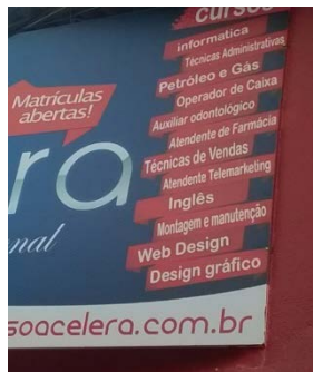
Figura 5: Banner comunicando os cursos técnicos para matrícula. Elaborado pelos autores, com base na pesquisa realizada.

A aplicação de 11% dos registros remete design à disciplina e todas possuem vínculos com cursos técnicos. Com exceção de um, que foi coletado do facebook, todos foram coletados em bairros de IDHM médio. No exemplo da figura 4, o banner, com o uso da palavra, comunica alguns dos seus cursos oferecidos, como “web design” e “design gráfico”.