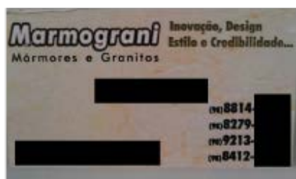
Figura 6: Cartão de visita da empresa Marmograni com uso da palavra design classificada como aparência de produto. Elaborado pelos autores, com base na pesquisa realizada.

Por último, 9% estão aplicadas para design como aparência de produto. No exemplo da figura 6, a propaganda de uma empresa de mármore e granitos apresenta, em seu cartão de visita, vários adjetivos para promover o seu trabalho e design, aqui, é empregado para conotar estilo e aparência. Tal fato também é explicado por Landim (2008), que destaca que o público tem grande dificuldade em compreender a prática do design e o entende somente superficialmente, especificamente rementendo o design apenas a beleza e a comunicação comercial. Esse apossamento da palavra design como estilo e aparência veio com a busca da diferenciação no mercado competitivo. Bonsiepe (2012) constata essa questão ao afirmar que o público frequentemente compreende o design de modo superficial, que acaba sendo amplamente vinculado apenas aos valores estéticos-formais.