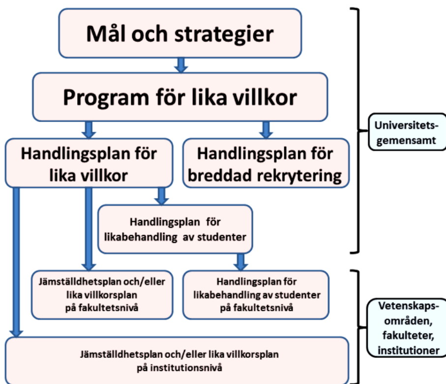
Figur 1. Flödesschema över universitetets mål- och regeldokument inom likavillkorsområdet

I Uppsala universitets Handlingsplan för lika villkor 2014-2016 står att det på fakultets- och institutionsnivå ska upprättas antingen en handlingsplan för lika villkor eller en jämställdhetsplan. Planerna ”ska innehålla uppföljningsbara mål samt anvisningar om tidsbestämda konkreta åtgärder där ansvariga anges” (s. 4). Figuren nedan illustrerar vilka dokument som upprättas på de olika institutionerna där pilarna visar vilka dokument som ligger till grund för de andra (figuren är hämtad från universitetets Handlingsplan för lika villkor 2014–2016 , s. 15).