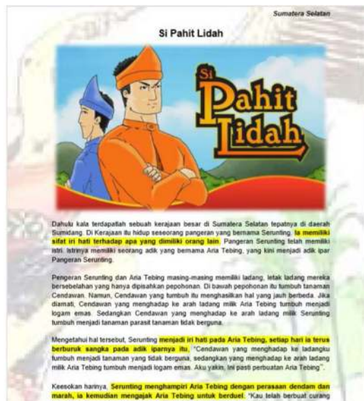
Gambar 2 Contoh Cerita Rakyat: (a) Cerita “Amad Rhang Manyang” dari Aceh di sebelah kiri dan (b) Cerita “Si Pahit Lidah” dari Sumatera Selatan di sebelah kanan