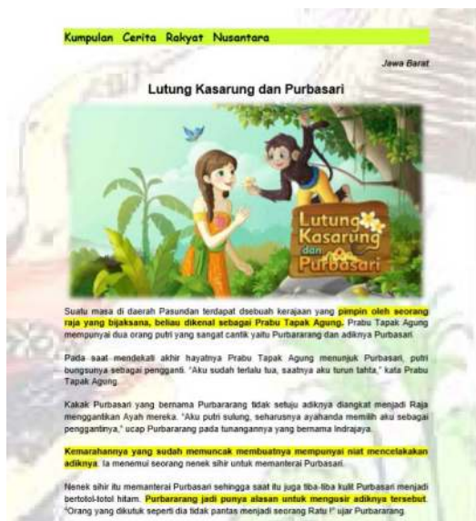
Gambar 3. Cerita Rakyat “Lutung Kasarung dan Purbasari” dari Daerah Jawa Barat

Pengembangan bahan ajar literasi membaca dengan menggunakan cerita rakyat nusantara mengadopsi model pengembangan Plomp telah berhasil dilaksanakan dengan baik. Bahan ajar literasi membaca dengan menggunakan cerita rakyat nusantara telah divalidasi oleh para ahli. Penggunaan warna setiap cerita disesuaikan dengan gambaran umum latar cerita. Cerita didisain sesuai dengan bahasa yang mudah dipahami oleh siswa SD.