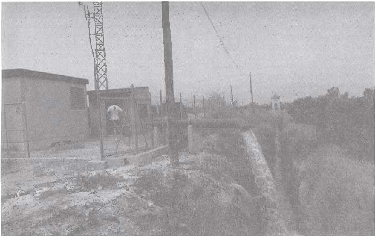
"Bomba para extraer aguas subterráneas en situaciones de escasez en la Acequia Real del Júcar".