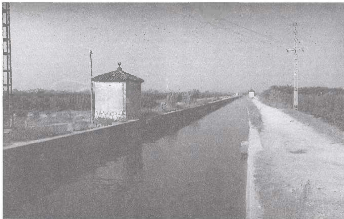
"El canal principal y fesas de la Acequia". Real del Júcar.

Cuando se quita el agua al arroz, el primero que debe levantar las compuertas es el de abajo y luego el de arriba; para no inundar demasiado a los de abajo. Una tarea constante cuando el cultivo del arroz está en pie, es que el agua debe estar en permanente circulación para evitar anacrobiosis drástica en el marjal y se realiza por medio de motores eléctricos, los cuales bombean el agua desde las partes bajas hacia las zonas más altas para que vuelva a escurrir por gravedad.