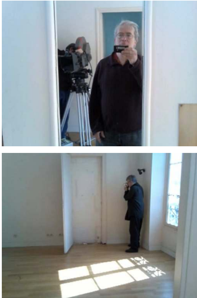
Figura 5 y 6. J'aimerais partager le printemps avec quelqu'un (Joseph Morder, 2007).

propio trabajo cinematográfico y la actividad como filmeur de Cavalier. El total despojamiento del gesto fílmico de ambos cineastas queda registrado.