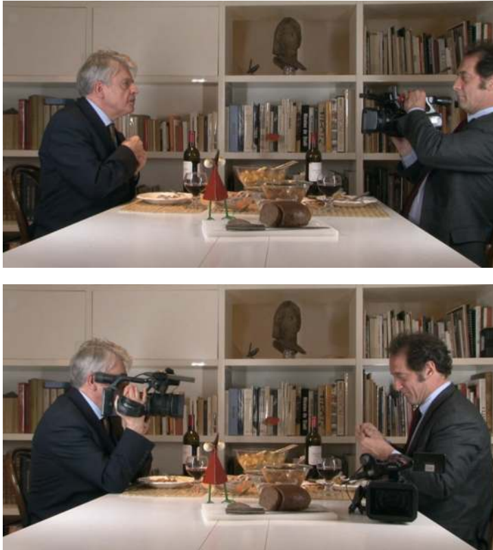
Figura 7 y 8. J'aimerais partager le printemps avec quelqu'un (Joseph Morder, 2007).

De la misma manera, la experiencia de la realidad se hibrida con la creación de una ficción: "... nos filmamos los dos en nuestra vida cotidiana. Y bajo la mirada del espectador, nos transformamos de forma regular y según las circunstancias en personajes de ficción, antes de volver a nuestros asuntos diarios" (Cavalier, 2011, s.p.). Si Morder insertaba la ficción en el diario sin evidenciarla, proponiendo una discusión sobre su indiscernibilidad, Cavalier aborda esta misma cuestión a través de su oposición dialéctica.