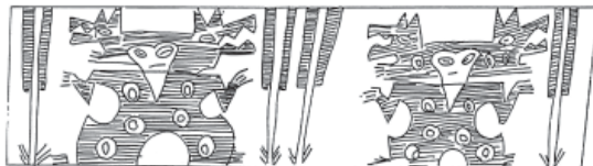
Figura 6. Personajes con felinos.