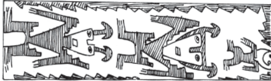
Figura 10. Personajes con adornos cefálicos en forma de ancla.