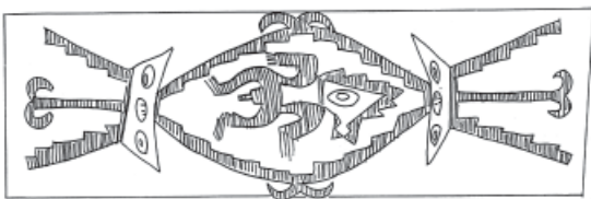
Figura 2. Personaje con máscara felínica.

El tipo denominado “Personaje con máscara felínica” está presente en nuestra muestra a través de dos piezas (Figuras 2 y 3).