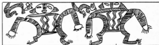
Figura 1. Pieza 11784: muestra manos circulares y dedos hechos con líneas.

Para el análisis del material se tomó como punto de partida la descripción establecida por González