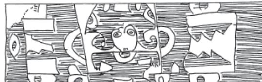
Figura 7. Personaje con felinos.