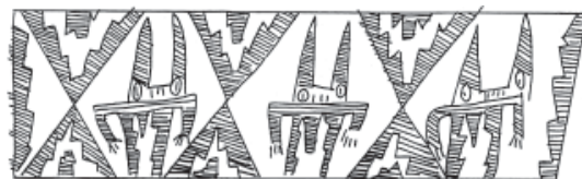
Figura 8. Personaje con máscaras no identificadas.

respondería con el Personaje Flanqueado por Felinos. Dentro de este grupo proponemos diferenciar dos modos de representación: