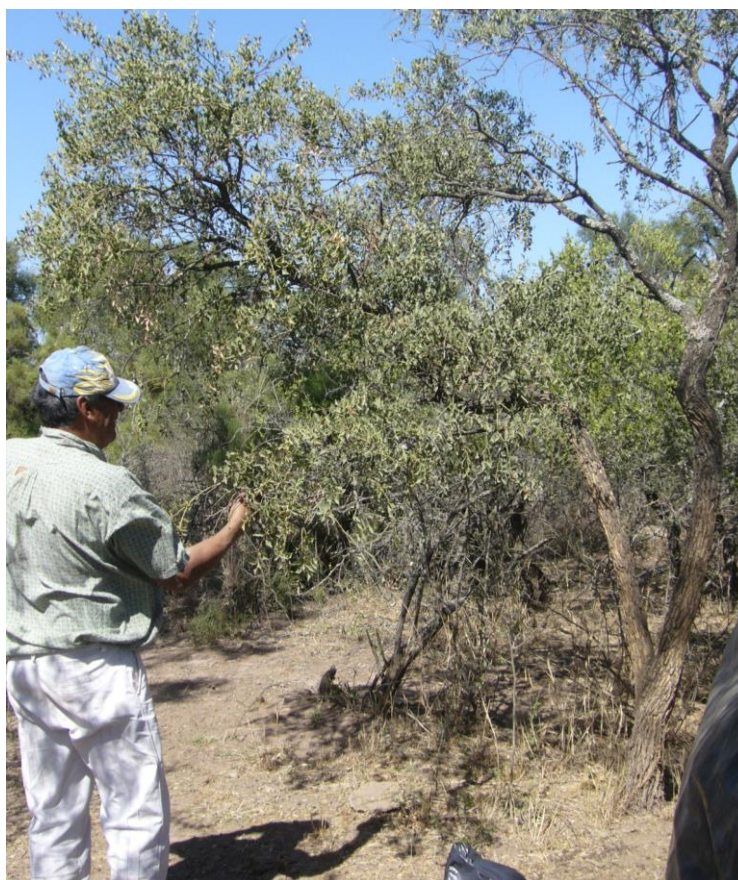
Figura 2 Caminata etnobotánica

de las plantas, los saberes relacionados a los usos de esas plantas, la vigencia de tales usos, es decir, si actualmente las seguían usando o no, y en algunos casos se indagó sobre formas de uso o partes de las plantas utilizadas. Finalizada esta etapa inicial del trabajo, se procedió, en los viajes siguientes, a la aplicación de entrevistas abiertas y semiestructuradas para indagar sobre aspectos específicos, como vigencia del uso, partes de las plantas utilizadas, formas de preparación y administración. Para esto se utilizaron fotos de visitas anteriores y tablas con nombres locales de plantas y en algunos casos se realizaron nuevas caminatas.