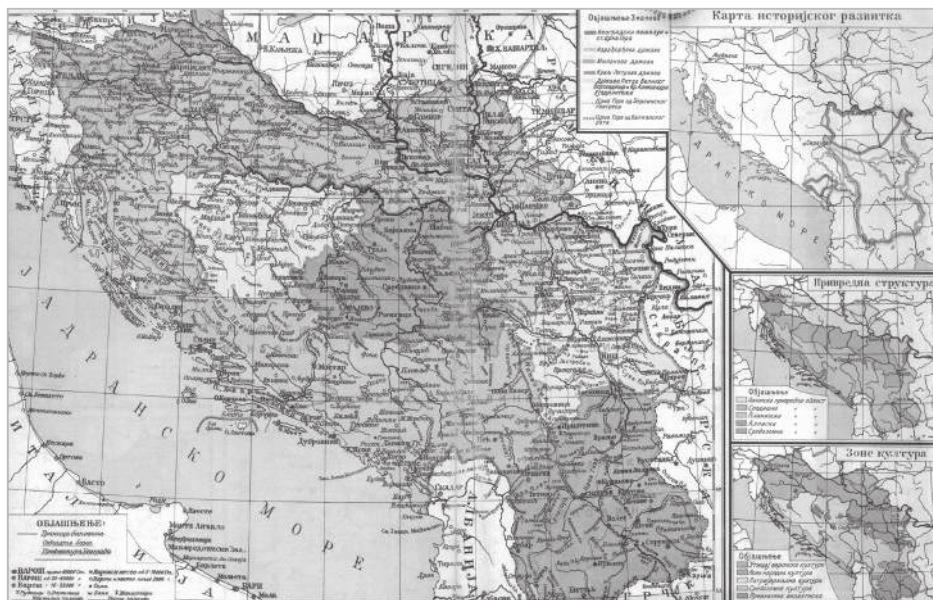
Banovine v Kraljevini Jugoslaviji. Dravska (se pravi slovensko območje) je neposredno mejila z Avstrijo in po anšlusu na Tretji rajh

vanskih okrajev znašla najbližje Tretjemu rajhu.