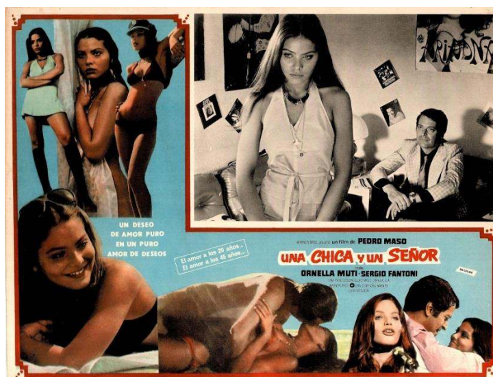
Figura 6: Afiche de Una chica y un señor (1973)

Finalmente, podemos hablar de un grupo de películas que ofrecen una visión diferente del turismo, a pesar de describir las relaciones de los sujetos turísticos y utilizar de manera profusa los escenarios de la Costa del Sol. Estos dramas, abordan los problemas de las relaciones extramaritales, la liberación sexual y los tópicos turísticos de manera diferente a las comedias antes clasificadas. Días de viejo color (1967), Una chica y un señor (1973) y la mencionada El puente (1976).