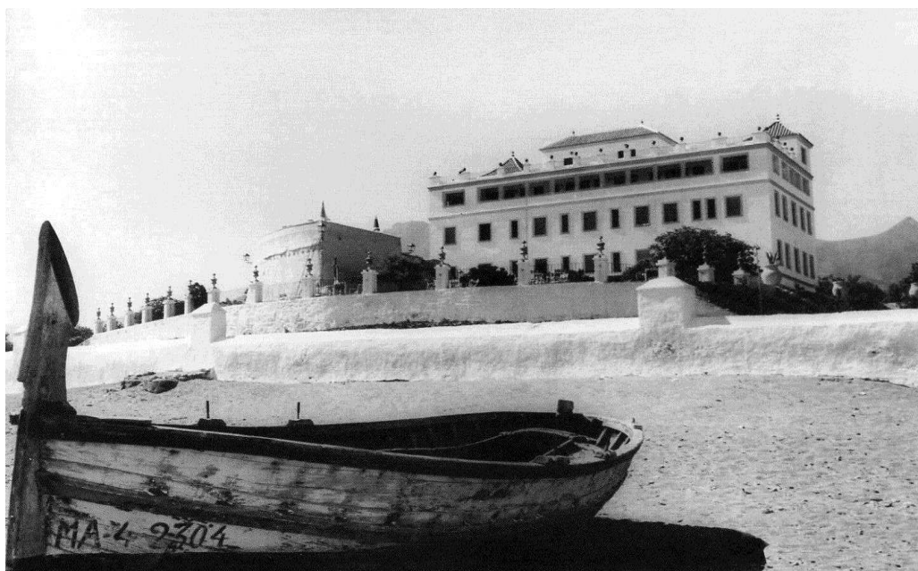
Figura 1: Imagen Hotel El Fuerte en la década de 1950