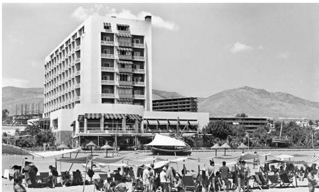
Figura 2: Hotel Pez Espada y playa de Torremolinos. Año 1963