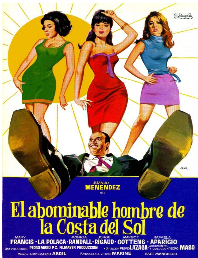
Figura 3: Cartel promocional de El Abominable hombre de la Costa del Sol (1968)

española (1966), Operación cabaretera (1967), Una vez al año ser hippy no hace daño (1968) y El abominable hombre de la Costa del Sol (1968).