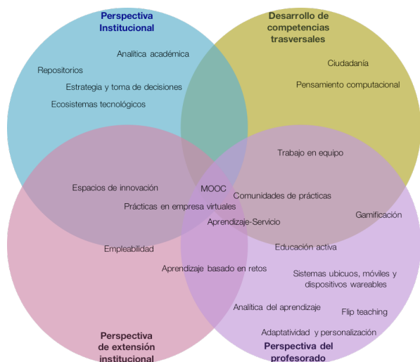
Figura 1. Mapa de tendencias en Innovación Educativa (Español).

en las diferentes intersecciones entre las regiones representadas se localizan también interesantes tendencias que combinan características de las zonas afectadas. No se buscar hacer una revisión, por somera que fuera, de todas y cada una de las tendencias identificadas en el mapa, pero a modo de ejemplo se van mencionar algunas de ellas.