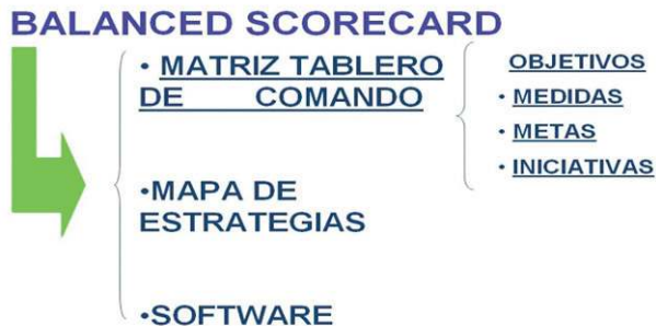
Figura 3. Componentes del Balanced Scorecard [11]

Mismos que deben interactuar eficazmente para conseguir su efectiva aplicación en una compañía, así como la obtención de resultados empresariales de excelencia.