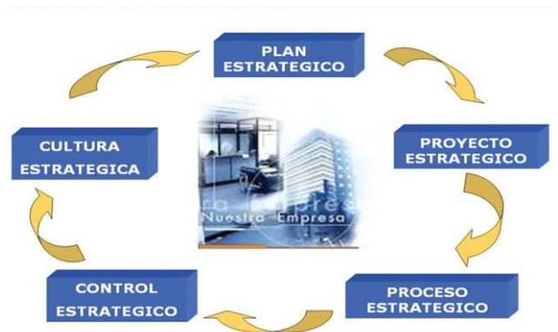
Figura 2. Ejecución estratégica que impulsa el aprendizaje Organizacional [5]

Se podría pensar que se trata de alguna técnica nueva y sin embargo sus orígenes se remontan a los años de la antigua Grecia en que el Strategos [6] o General del ejército pensaba por adelantado en los combates y simulaba las acciones ofensivas y defensivas para mejorar los posibles resultados de las batallas y en base a estos análisis se tomaban las Decisiones que se vivirían luego en el campo de conflicto.