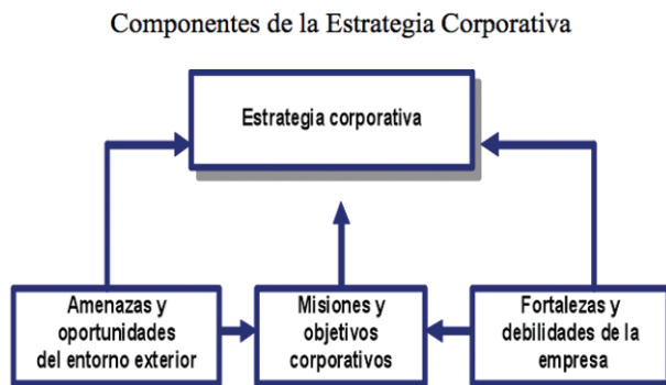
Figura 1. Esquema gráfico de causa y efecto para construir una Estrategia Corporativa. [3]

La estrategia de una empresa descansa en el hecho de llevar a cabo la planificación estratégica mediante un proceso para adaptar a largo plazo sus recursos y objetivos a las potencialidades que el mercado presenta. La estrategia corporativa es transfuncional, logrando adaptarse a las diversas necesidades en los diferentes niveles organizacionales. Es necesario el control continuo de la estrategia para determinar el cumplimiento de los objetivos estratégicos.