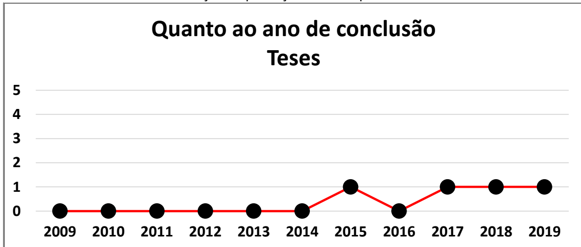
Figura 3. Gráfico mostrando a distribuição da produção de teses por ano