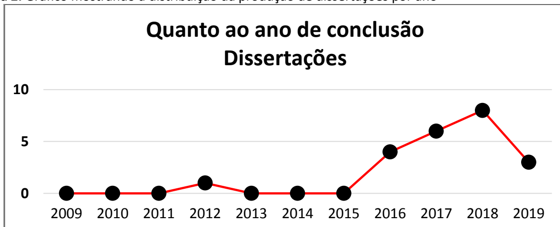
Figura 2. Gráfico mostrando a distribuição da produção de dissertações por ano