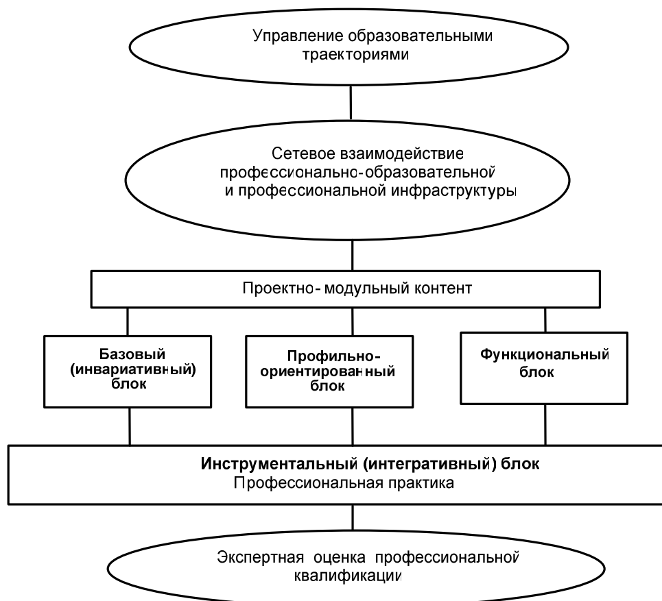
Рис. 2. Модель профессионально-образовательной платформы формирования транспрофессионализма субъектов профессиональной деятельности

Fig. 2. Model of the professional and educational platform of transprofessionalism formation among the members of professional activity