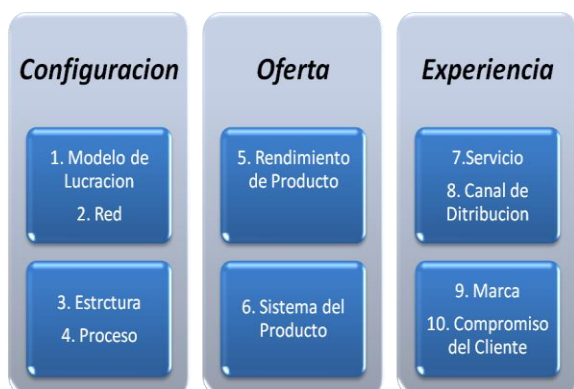
Figura 1 - Categorización de "Innovación".

Fuente: Elaboración Propia con base a Keeley, Pikkell, Quinn, & Walters (2013).