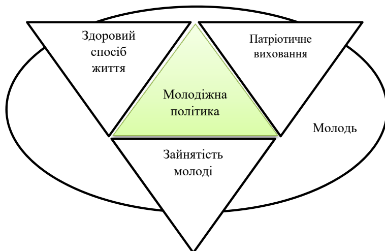
Рис. 2. Пріоритетні напрями розвитку молодіжної політики в Україні

Молодіжна політика в Україні сьогодні у своєму розвитку має три пріоритетні напрями, на які спрямовані всі її принципи, такі як зайнятість молоді, здоровий спосіб життя та патріотичне виховання (рис. 2).