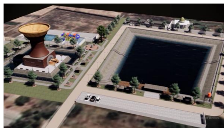
Gambar 4. Tampak atas area Monumen Kreweng terlihat kolaborasi dengan berbagai wahana