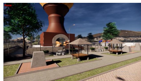
Gambar 2. Monumen Kreweng dengan taman rekreasi