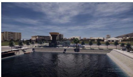
Gambar 5. Tampak depan Monumen Kreweng berkolaborasi dengan embung sebagai view