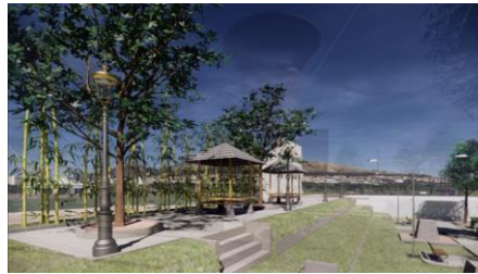
Gambar 3. Area taman Monumen Kreweng sebagai bentuk kolaborasi

dan menampung suplai aliran air hujan serta untuk meningkatkan kualitas air di badan air yang terkait (sungai, danau). Desa Juron terkenal dengan embung, yang dalam hal ini mampu menambah landscape indah dari Monumen Kreweng. Monumen hadir sebagai sebuah kesatuan dan kolaborasi dari berbagai elemen pendukungnya termasuk embung yang menjadi pemandangan alamnya.