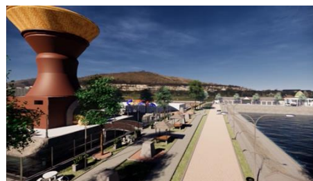
Gambar 1. Monumen Kreweng dengan view embung di depannya

Karya ini memuat gambaran yang cukup jelas tentang proyeksi desa wisata di daerah Juron, Sukoharjo. Konsep diferensiasi pada karya ini terlihat pada Monumen Kreweng yang menjadi pusat perhatian. Monumen Kreweng ini menjadi pembeda daerah daerah lain karena mengangkat kearifan lokal yaitu kreweng . Desa Juron sejak lama telah mewarisi kreweng atau tanah liat sebagai bahan tradisional untuk peralatan dapur. Selain itu, bentuk Monumen Kreweng merupakan sebuah simbolisasi dari tungku tradisional yang menjadi warisan bernilai di Desa Juron.