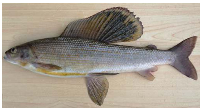
Рис. 2. Сибирский хариус из оз. Собачье (самец, длина по Смитту 384 мм)

В расположенном южнее бассейне р. Хантайки ранее была обнаружена симпатрия двух форм (видов) хариусов (Романов, 2004а). Тогда предполагалось, что один из них западно-сибирский, а второй – восточно-сибирский подвиды сибирского хариуса. Позднее было определено, что тот, который считался западно-сибирским подвидом сибирского хариуса в этом бассейне, генетически аналогичен черному байкальскому хариусу (Weiss et al., 2007). Сравнение некоторых меристических признаков показало, что отли-