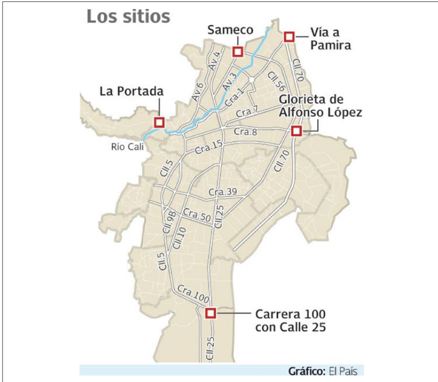
Figura 2. Terminales de carros piratas en Cali

los trayectos del transporte ilegal. Mientras el transporte formal converge en los centros de producción y vivienda, los accesos informales conectan ese transporte formal y los lugares periféricos (Jamundí, la vía a Palmira o la vía al mar). Los datos de la Alcaldía municipal muestran que existe una correlación fuerte entre las rutas de transporte informal, los barrios “ilegales” y las zonas más violentas de Cali (Valdes, 2014).