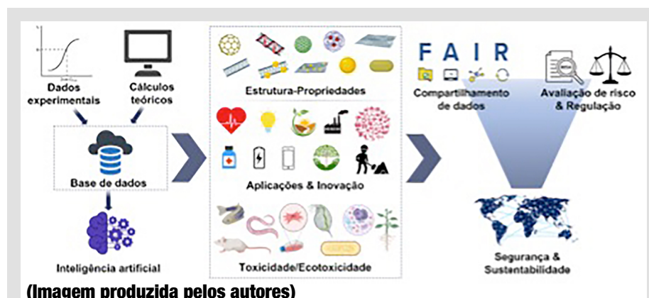
Figura 3. Abordagem integrada envolvendo a associação de dados experimentais com métodos computacionais, estruturação de bancos de dados e inteligência artificial para aplicações e toxicologia preditiva visando o desenvolvimento seguro e sustentável de nanomateriais funcionais.

O estudo e engenharia de materiais em nanoescala é uma excelente oportunidade para geração de novos produtos e tecnologias em setores estratégicos como saúde, energia, eletrônica, materiais avançados, agricultura e ambiente, entre outros. Contudo, a avaliação da segurança química de um nanomaterial é essencial para garantir que a sua produção e aplicações prosperem, sem provocar impactos negativos aos trabalhadores, consumidores e ao meio ambiente. Idealmente, cada estágio da vida de