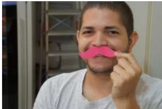
Foto 6. Participação dos homens na ação do IFMA-Coelho Neto/Ma, Brasil.