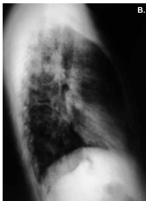
Figura 1. (A) Radiografía de tórax proyección posteroanterior. Patrón micronodulillar sin patrón de consolidaciones. Volumen pulmonar conservado. (B).Radiografía de tórax proyección lateral. Ángulos costo y cardiofrénicos de aspecto normal.