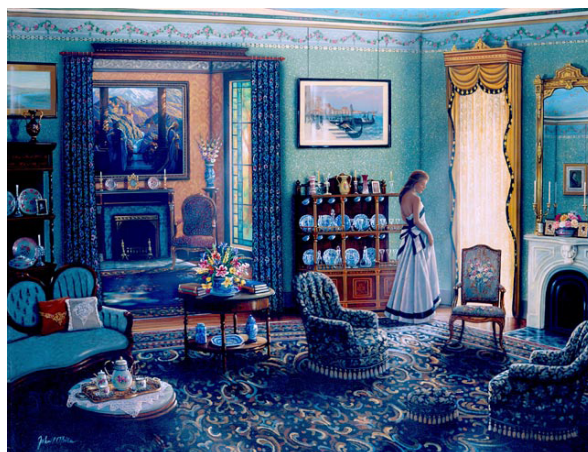
Figura 2. "Afternoon Light", John P. O'Brien.

ticos de las clases medias en las principales ciudades de Inglaterra, España, Francia, Italia y Estados Unidos eran signo del carácter de sus ocupantes, convirtiéndose en un espacio para la negociación, la construcción y la exhibición de las identidades de sus moradores (Rybczynski, 1989, pp. 177-180; Crowley, 1999, pp. 757-759; Baxter, 2010, p. 3; Cruz, 2011, p. 72). Como puede apreciarse en la Figura 2, más que el bienestar físico, esta noción buscaba resaltar los elementos que reflejaran la personalidad de los dueños de la casa, sus gustos, su interés por valores como la gentileza, el orden, la elegancia y la pátina o respeto al patrimonio. Seguramente, esto se tradujo en el uso de mobiliario fabricado con maderas finas y tapizado