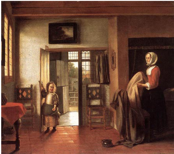
Figura 1. "El dormitorio". Pieter de Hooch, 1658-1660.

Fuente: http://www.oceansbridge.com/oil-paintings/product/1228/thebedroom16581660