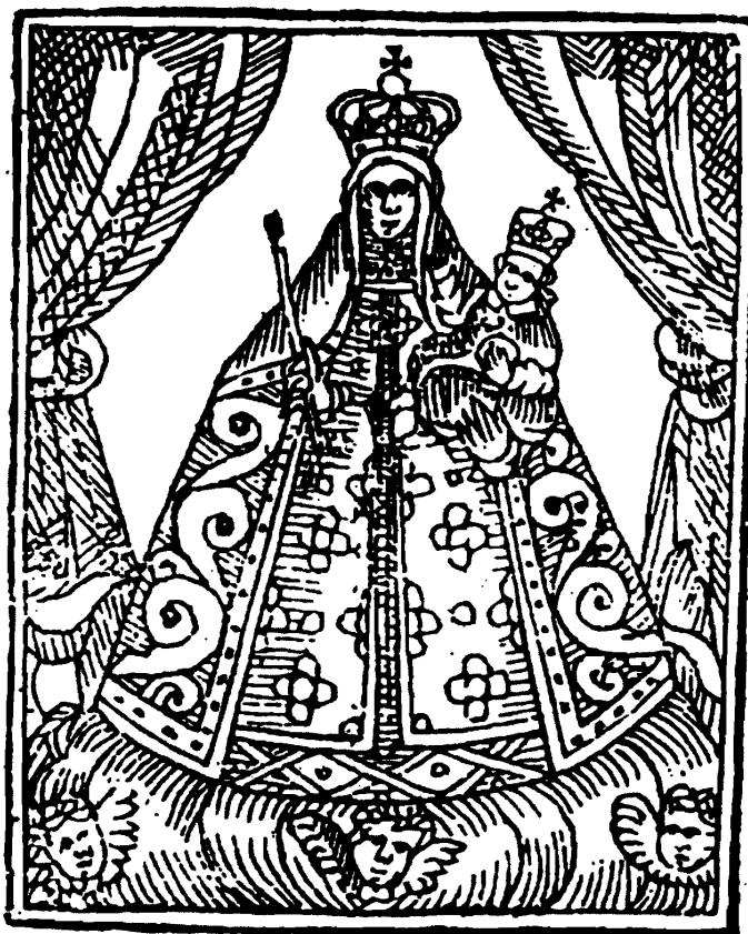
LÁMINA 4. Calatayud. Grabado de N.ª S.ª de Copacabana, incluido en «Los Gozos de la milagrosa V. de Copacabana. 1688». (A partir del publicado en García Marco, Fco.: op. cit., pág. 169).

En él, además de una composición de abalanza que concluye con una oración, se reproduce un grabado de la Virgen existente en el convento de Agustinos de Santa Mónica de aquella ciudad. (Lámina 4) Éste sigue la iconografía de la imagen vestida con un gran manto, que le proporciona la característica forma triangular, difundida a través de los grabados de la obra de Ramos Gavilán y Fernando Valverde. Según relata el autor del estudio, apareció como una hoja suelta en un protocolo notarial de Calatayud, lo que nos puede dar idea de la difusión alcanzada por este tipo de publicaciones, fomentando la divulgación de su devoción e iconografía.