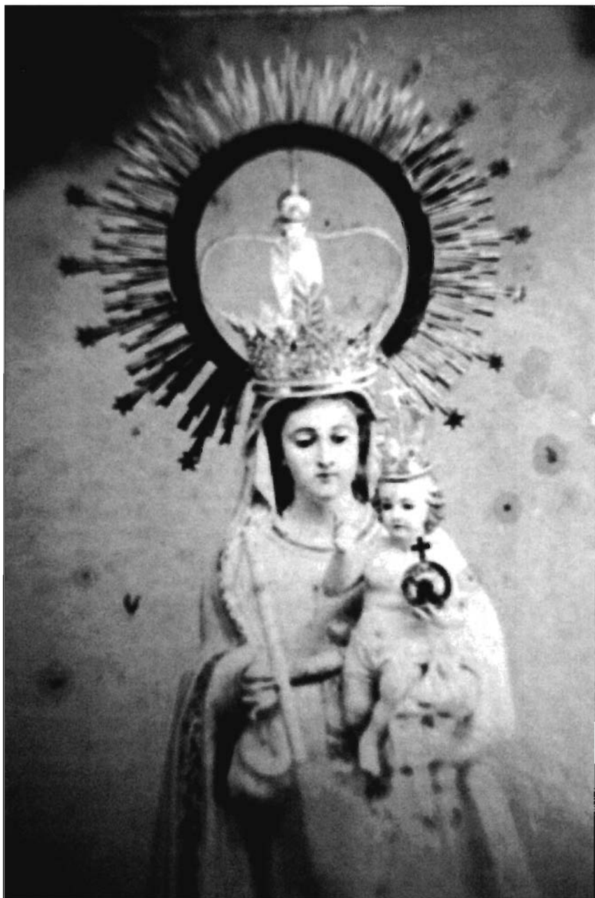
LÁMINA 8. Rubielos Altos. Detalle de la Antigua imagen de N. a . S. a . de Copacabana. (Fotografía anterior a 1936).