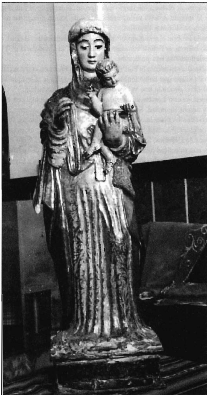
LÁMINA 1. Bolivia. Imagen de N ra . S ra . de Copacabana realizada por Francisco Tito Yupanqui.