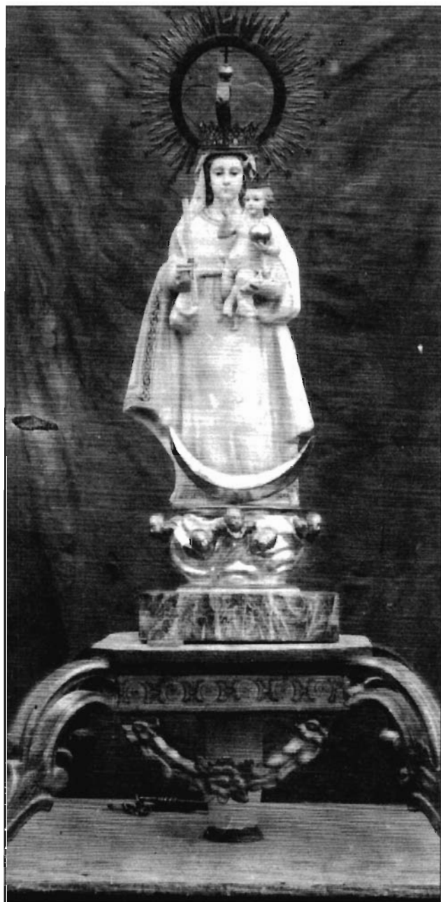
LÁMINA 7. Rubielos Altos. Antigua imagen de N ra . S ra . de Copacabana. (Fotografía anterior a 1936).