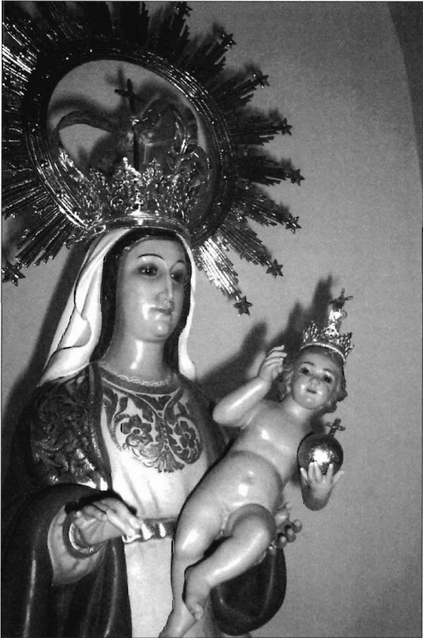
LÁMINA 12. Rubielos Altos. Detalle de la Imagen actual de N ra . S ra . de Copacabana.