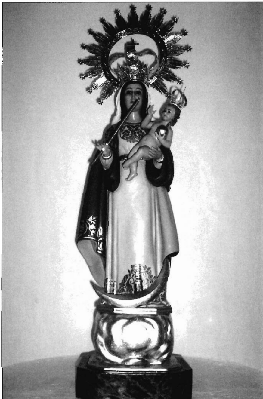
LÁMINA 11. Rubielos Altos. Imagen actual de N ra . S ra . de Copacabana.