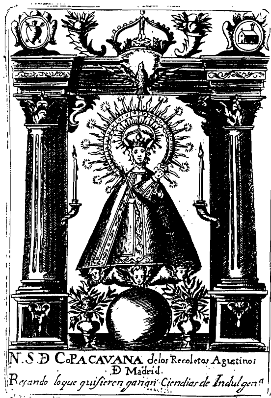
LÁMINA 3. Imagen de Ntra. Sra. de Copacavana (grabado impreso en el libro de fray Andrés de S. Nicolás. Imagen de Ntra. Sra. de Copacabana... Madrid 1663).

Al parecer, hubo otra imagen en Turín, en el Convento de Agustinos Descalzos, conservándose un grabado italiano en la Biblioteca Nacional de París, que reproduce la característica imagen triangular, con amplia capa y un dosel de cortina, yendo coronados la Virgen y el Niño 24 .