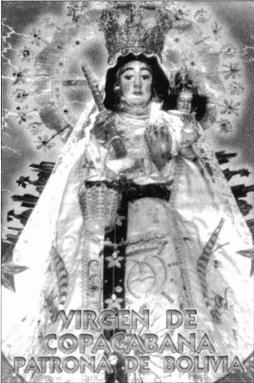
LÁMINA 2. Bolivia. Imagen Vestida de N ra . S ca . de Copacabana realizada por Francisco Tito Yupanqui.