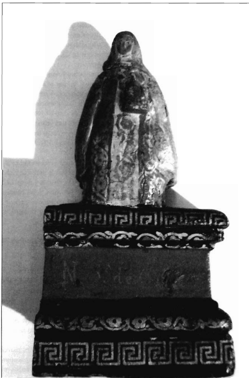
LÁMINA 6. Ntra. Sra. de Copacabana, Ermita de Ntra. Sra. del Encinar. Ceclavín (Cáceres).