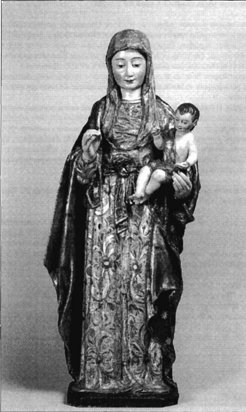
LÁMINA 5. Sevilla. Monasterio de la Madre de Dios. Imagen de N ra . S ca . de Copacabana.