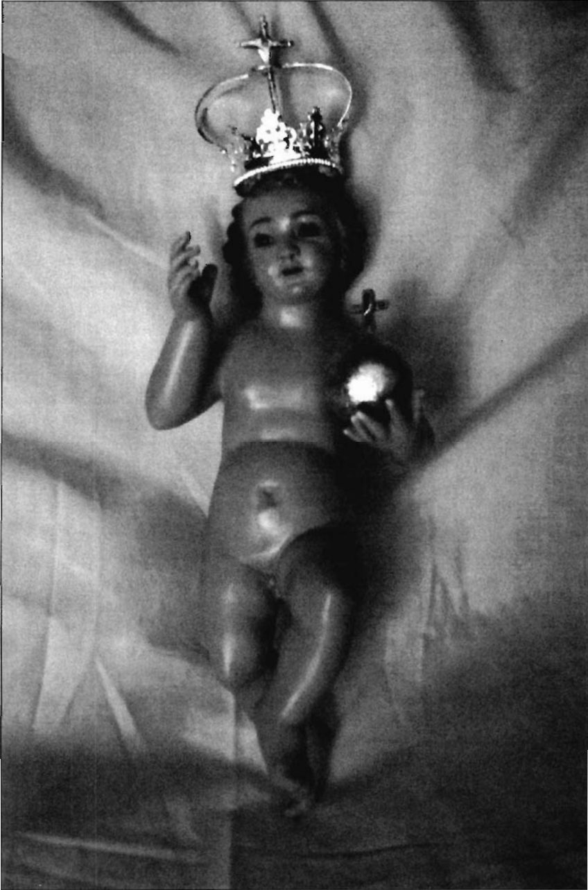
LÁMINA 9. Rubielos Altos. Niño Jesús de la imagen de N ra . S ra . de Copacabana.