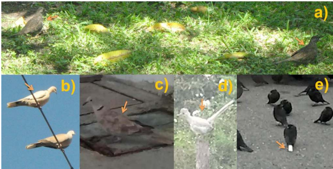
Figura 2. a) Dos individuos de tórtola ( Columbina inca ) con melanismo, incremento de coloración en el plumaje; b) Paloma turca ( Streptopelia decaocto ) con aberración ino en alas; c) Paloma turca ( Streptopelia decaocto ) con aberración ino en alas con diferente grado de decoloración; d) Correcaminos norteño ( Geococcyx californianus ) con aberración ino con todo el plumaje decolorado; e) Tordo de ojo rojo ( Molothrus aeneus ) con leucismo parcial en plumas rectrices.