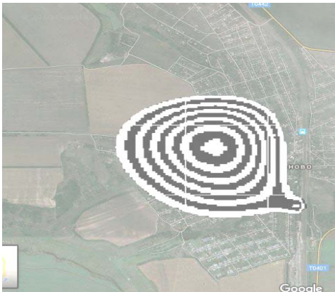
Fig. 4. Spatial distribution of NH 3 , t = 169 \text{ sec} (level z = 10 \text{ m} )

It is clear from Fig. 2–4 that the contamination area is formed under the following factors: initial cloud appearance + long term emission from the moving train + atmosphere dispersion and wind.