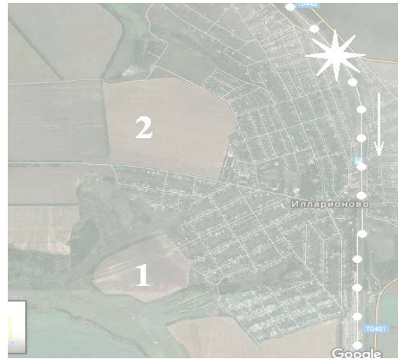
Fig. 1. Satellite image near Railway Station « Illarionovo » : 1 – Site # 1 (farm field); 2 – Site #2 (farm field); dots show the rail way track; « star » shows the initial point of emission

The developed generic code « EMISSION » was used to solve the following problem. A train with toxic chemical (NH 3 ) moves near Railway Station « Illarionovo » (Dnipropetrovsk Region, Ukraine) and at time t=0 the instant emission of NH 3 takes place. This emission results in NH 3 cloud formation (Fig.2). Position of this instant emission is schematically shown as «star» in Fig.1 and «arrow» indicates the direction of the train movement. The train keeps moving after the accident and long term emission of NH 3 ( q = 5 \text{ kg/sec} ) follows the instant emission. So we have scenario « instant exhaust of toxic chemical + long term emission of it ».