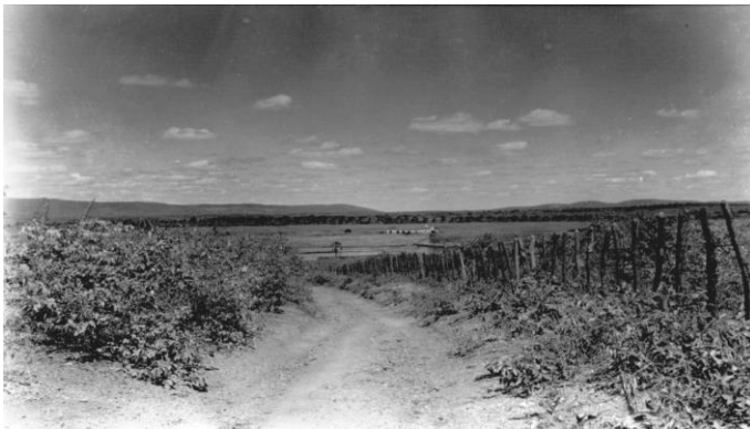
Figura 10 – Plantação de cana : Sítio Vargem Redonda Negativo: 942; Nº Registro: CE 10359 Geógrafo responsável: Lindalvo Bezerra dos Santos Ano: 1952