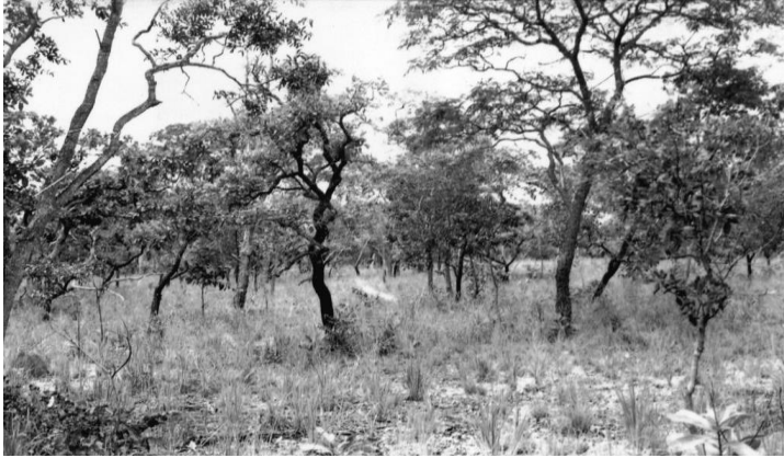
Figura 6 – Cerrado depois de Engenho da Água Negativo: 3475 ; N° Registro: MA 9850 Geógrafo Responsável: Alfredo José Porto Domingues Ano: 1957