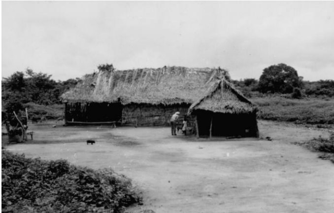
Figura 12 – Casa de agregado Negativo: 3502; N° Registro: RN10843 Geógrafo responsável: Alfredo José Porto Domingues Ano: 1957