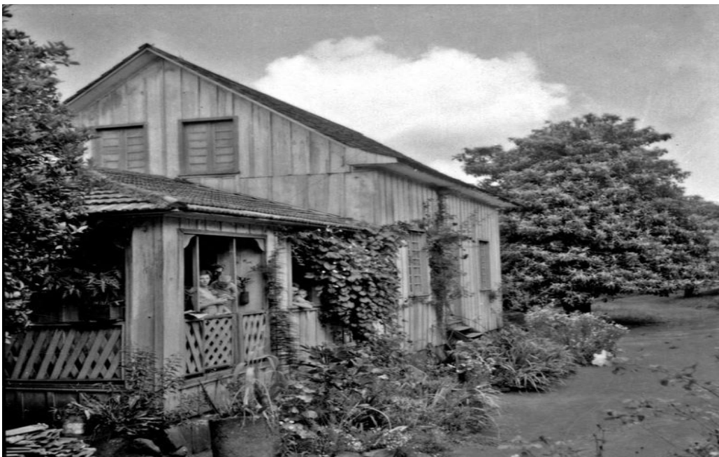
Figura 3 – Casa de colono de origem italiana no município de Xaxim (SC). 1965

Contextualizando a noção de paisagem ao conceito apresentado por Pereira (1943), podemos exemplificar por meio de fotografia selecionada que se confirma numa paisagem típica da Região Sul, aquilo que é característica daquela paisagem no campo, vista na construção de madeira e acentuada pelo modo de vida rural.