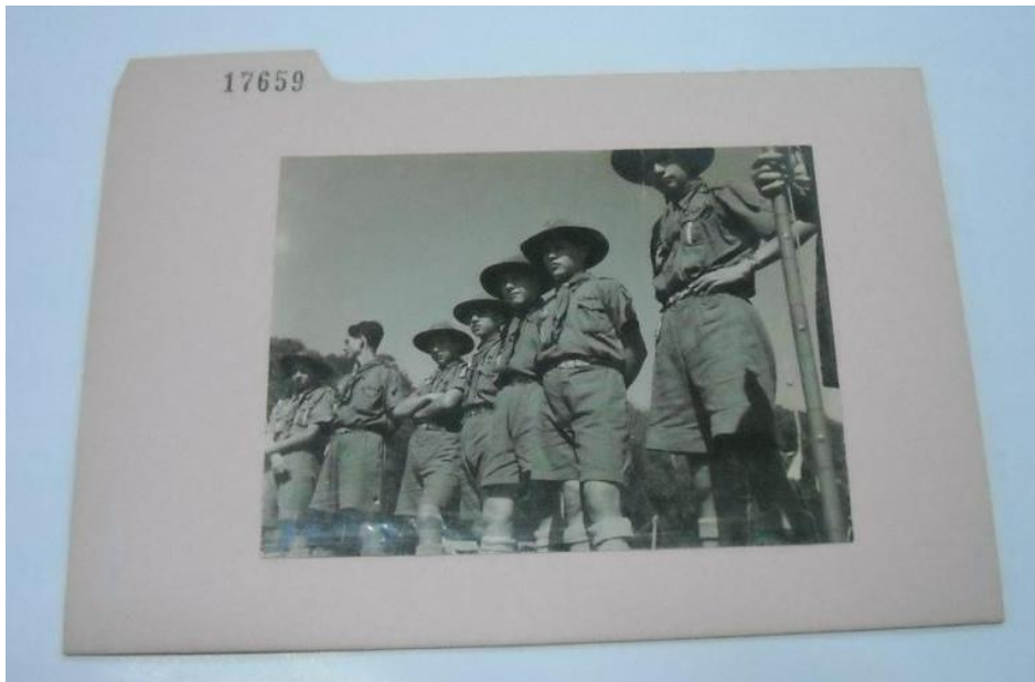
Figura 1 – Acampamento Internacional de Escoteiros. São Paulo, 1954