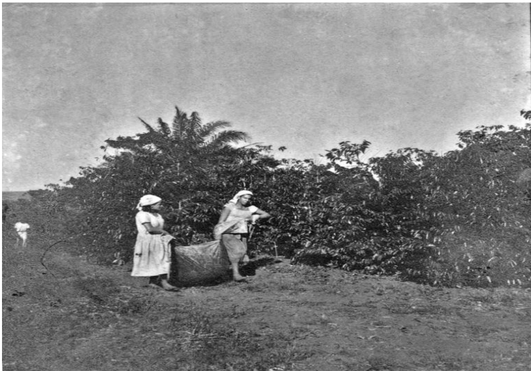
Figura 4 – Colônia agrícola de Ceres: mulheres na colheita de café (GO). [196-?]

A respeito da paisagem observada pelo geógrafo Pavageau, podemos exemplificar com a fotografia de mulheres colhendo café, na colônia agrícola de Ceres, em Goiás.