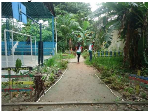
Fig. 1: Entrada do Jardim