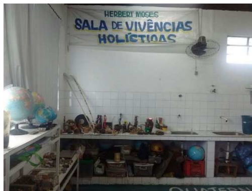
Fig. 5: Sala de Vivências Holísticas