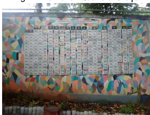
Fig. 2: Memorial Qual é a Graça?