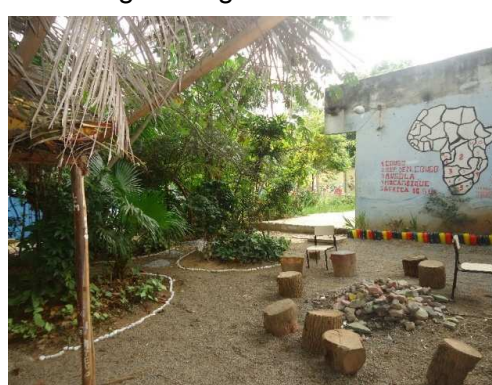
Fig. 4: Fogueira dos Anciões