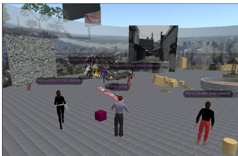
Figura 3. Fase do Jogo I-AI3

Para Bairon (2004), há atualmente na Internet muitas oportunidades para o desenvolvimento de metodologias hipermediáticas, que permitem ir além da divisão de tarefas, que explorem apenas a leitura e a escrita, ou apenas a arte (imagem e som). Temos que considerar a multiplicidade de multimodalidades que se projetam em diferentes ambientes virtuais e que podem se tornar significativas para a aprendizagem de uma língua estrangeira. De acordo com Fonseca (2005, p. 127), “podemos supor que as potências de imagens digitalizadas instauram um novo regime semiótico em que o referente é anulado remetendo às imagens a si próprias”.