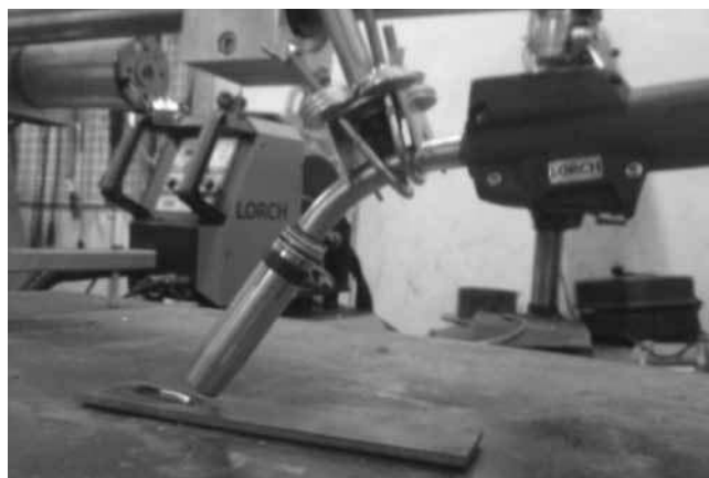
Rys. 2. Spawalnicze stanowisko badawcze z wykorzystaniem manipulatora postępowego podczas rejestracji przebiegów prądowo-czasowych

Fig. 1. The comparable testing station for TIG and SpeedRoot process