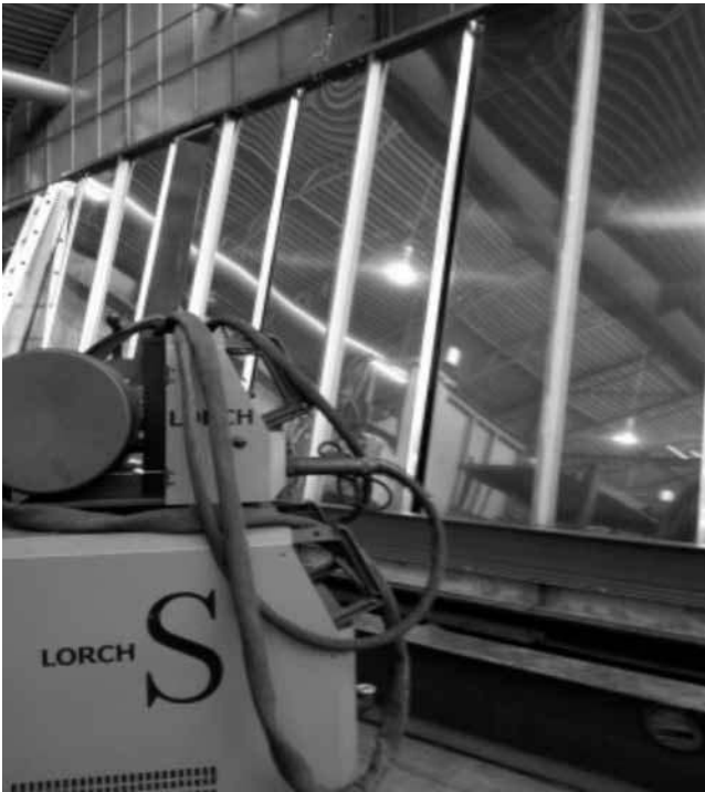
Rys. 4. Zasadnicza część filtra podczas montażu przy zastosowaniu metody SpeedRoot