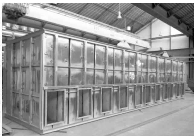
Rys. 3. Część filtra wykonanego metodą SpeedRoot Fig. 3. A part of filter made using SpeedRoot method

niż TIG, dodatkowym walorem było znaczne ograniczenie odształceń spawalniczych, które są trudne do kontrolowania w przypadku cienkościennych konstrukcji wielkogabarytowych (rys. 3 i 4). Duże znaczenie na decyzję inwestora o wdrożeniu miała również innowacyjność niskoenergetycznego procesu MAG SpeedRoot-LORCH. Nowa odmiana metody MAG jest oparta na znanym od lat 80. XX w. procesie przechodzenia kropli przy udziale sił pochodzących od napięcia powierzchniowego. Urządzenia starsze bazowały na tzw. hardware, co podnosiło znacznie cenę w stosunku