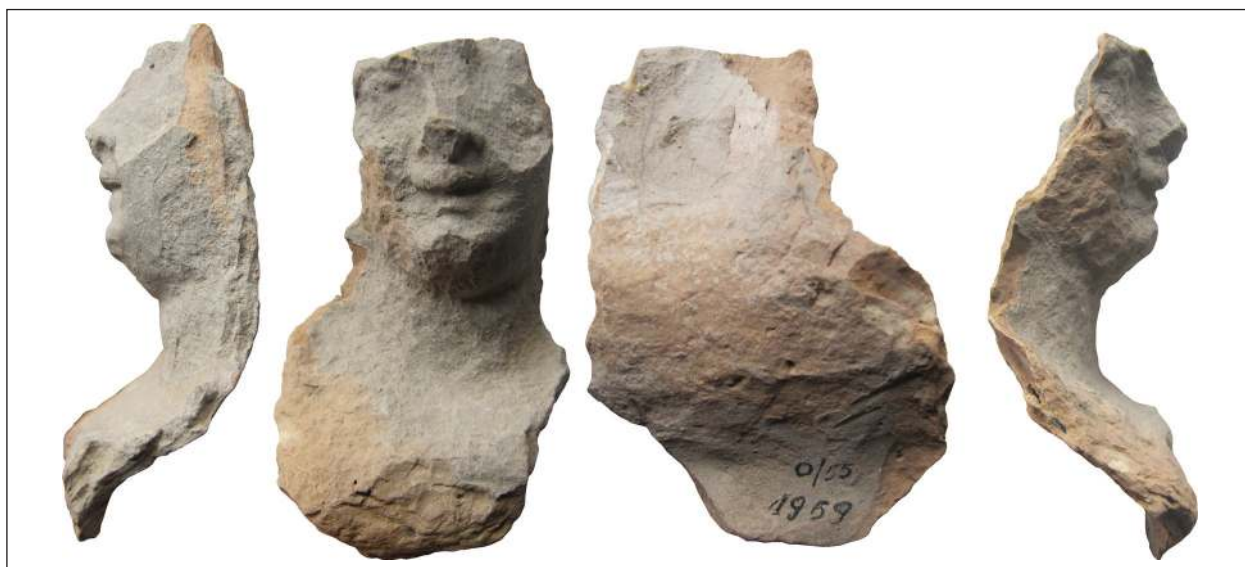
Рис. 6. Фрагмент погруддя-фіміатерія Афродіти (О-55/1959), розкопки О. І. Леві, О. М. Карасьова, Східний Теменос. НФ ІА НАНУ