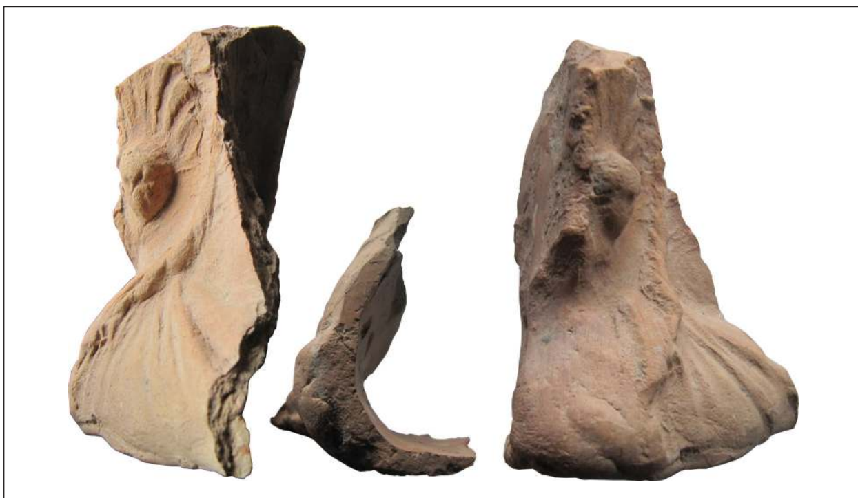
Рис. 12. Фрагмент погруддя-фіміатерія Афродіти (О-55/3103), розкопки О. І. Леві, О. М. Карасьова, ботрос на Східному Теменосі. НФ ІА НАНУ

ши в коропласта. Адже майстер працював, а, можливо, й продавав свій крам на священній ділянці. Ботрос слугував місцем захоронення залишків зі священної ділянки, тож ці погруддя-фіміатерії втратили свою цінність перед тим, як потрапили в цей контекст.