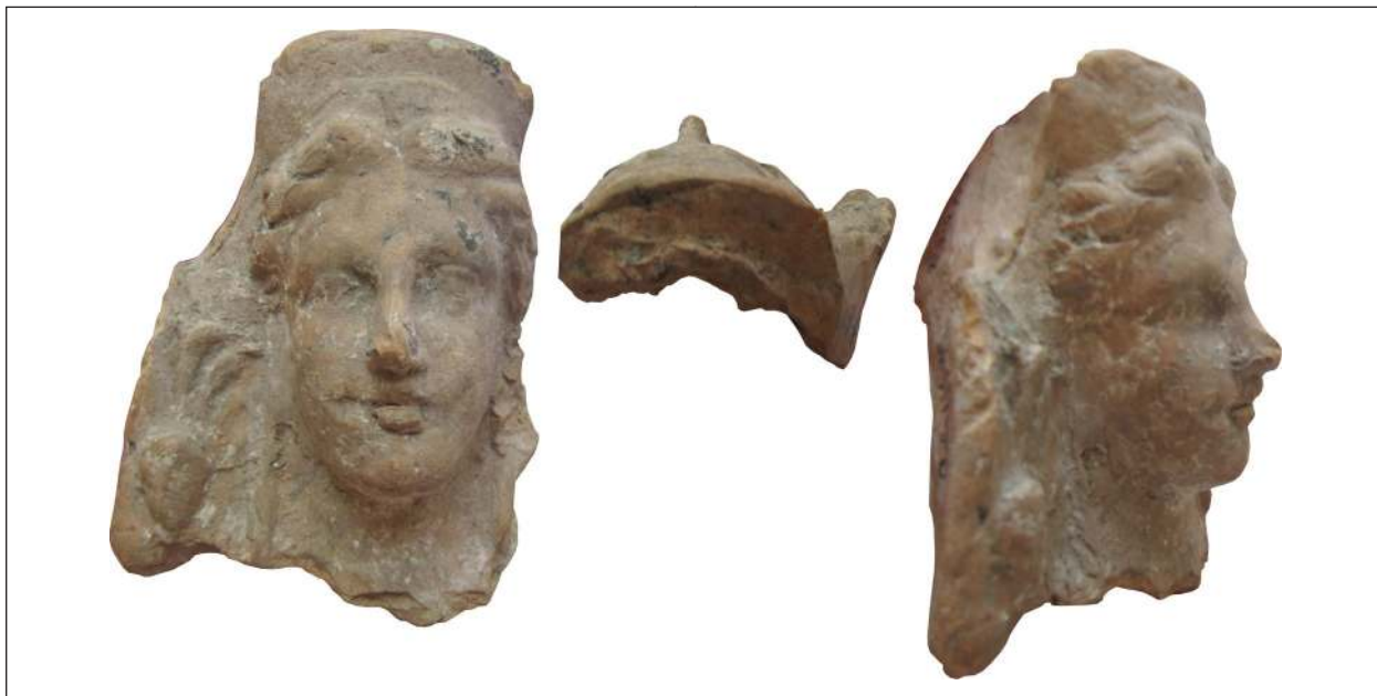
Рис. 11. Фрагментоване погруддя-фіміатерій Афродіти (О-36/1970), розкопки М. М. Худяка на ділянці И. Національний музей історії України