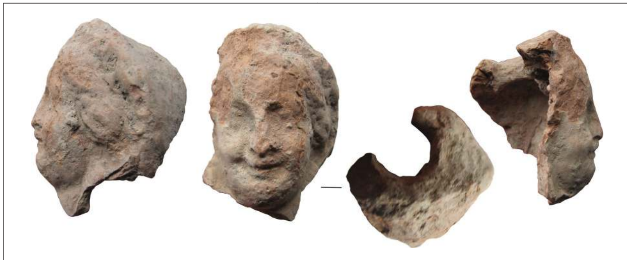
Рис. 5. Фрагмент погруддя-фіміатерія Афродіти (О-55/2155), розкопки О. І. Леві, О. М. Карасьова, Східний Теменос. НФ ІА НАНУ