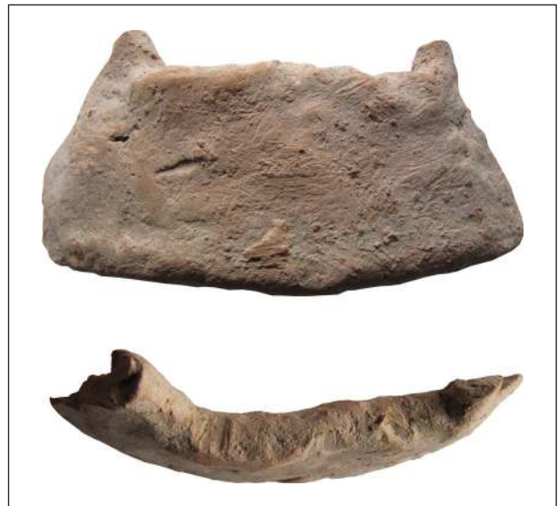
Рис. 9. Фрагмент погруддя-фіміатерія Афродіти (О-55/2989), розкопки О. І. Леві, О. М. Карасьова, ботрос на Східному Теменосі.

рою, яку короласти мали на увазі, створюючи нові образи богині та її супутників.