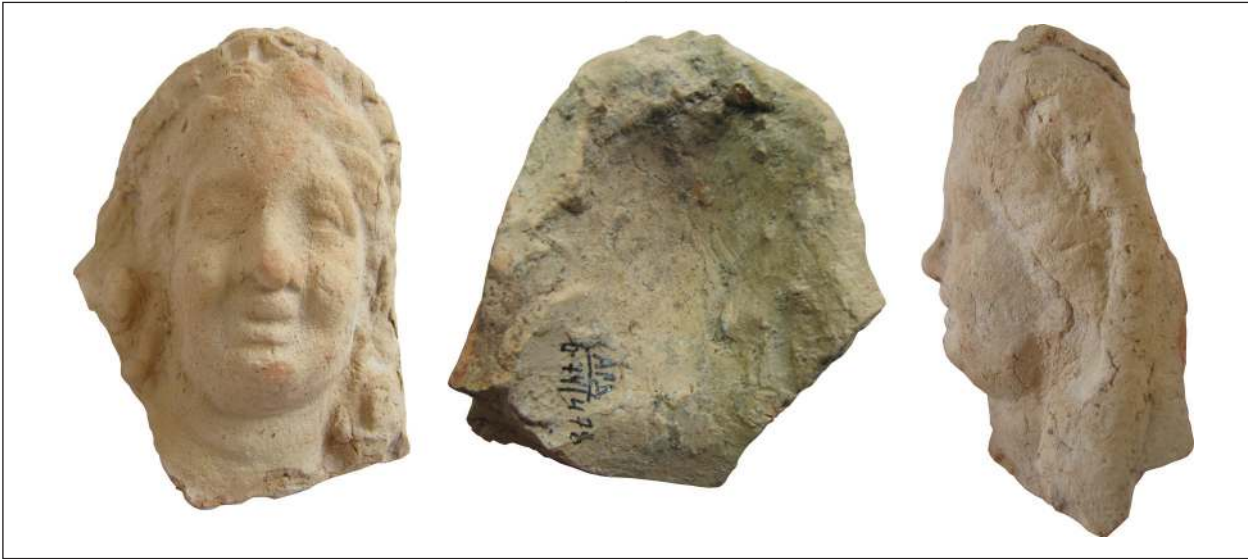
Рис. 2. Фрагментована протома Афродіти (О-74/АГД/478), розкопки А. С. Русяєвої, Західний Теменос. НФ ІА НАНУ

лено у формі, хоча, як і більшість ольвійських ліпних чаш, розташована вона не по центру голови. Чаша має дуже розплющені, аж відігнуті краї. Руки Афродіти, опущені вздовж тулуба, показано майже до ліктів. На обох плечах маленькі ероти тягнуться руками до обличчя Афродіти. Погруддя є близьким до ольвійських за розміром, а також за оформленням одягу. Завважимо, є паралелі і з тими зображеннями, які зазвичай трактують як Кору-Персефону (Русяєва 1979, с. 56, рис. 32). Це безрукавий хітон з трикутним вирізом на шиї, підв'язаний під грудьми. Виріз, близький до V-подібного, був популярний у короластиці початку III ст. до н. е. Його рідко виконували на великій скульптурі, він відповідав доволі розкутим образам (Burr Thompson 1963, p. 23, 80).