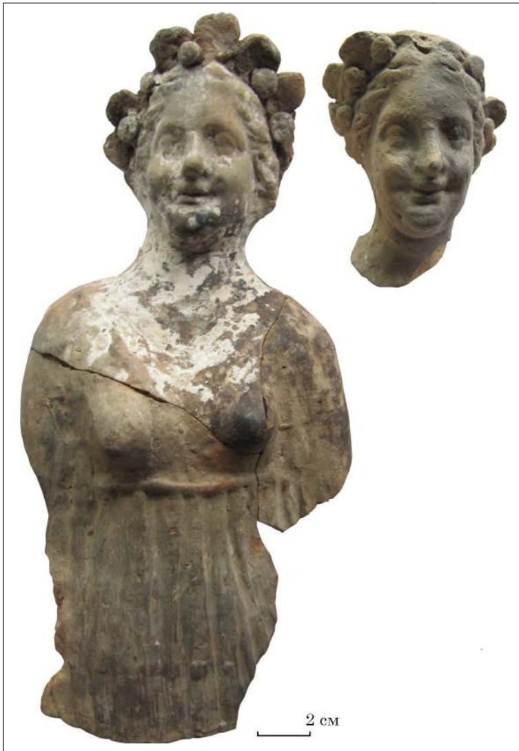
Рис. 10. Півфігурні зображення учасниць фіаса Діоніса, розкопки Л. М. Славіна, ділянка біля агори. НФ ІА НАНУ

лермо, на якому богиню показано в намисті з довгих підвісок, як на ольвійському зразку О-55/2979 (кат. № 13). Голови еротів тут виготовлено в окремих формах і доліплено до теракоти на краю плечей. На погруддях з Ольвії є зображення еротів на плечах впритул до шиї Афродіти на зразок тих, що були зображені у повен зріст.