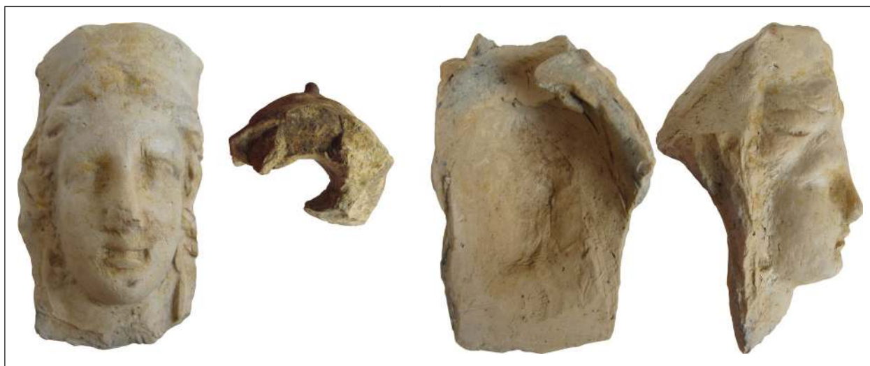
Рис. 13. Фрагмент погруддя-фіміатерія Афродіти (О-74/АГД/476), розкопки А. С. Русяєвої, ботрос на Західному Теменосі. НФ ІА НАНУ