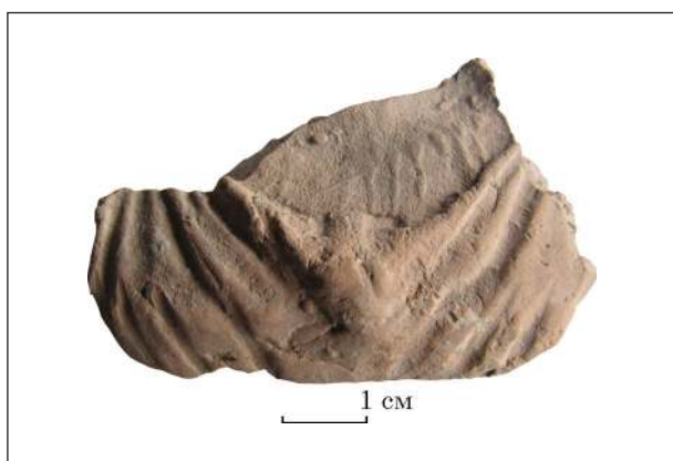
Рис. 15. Фрагмент погруддя-фіміатерія Афродіти (О-55/2979), розкопки О. І. Леві, О. М. Карасьова, ботрос на Східному Теменосі. НФ ІА НАНУ

Погруддя Афродіти з цілими фігурками еротів знайдено на ділянці Центрального Теменоса, але не в контексті ботроса, звідки походить Афродіта з еротами на тлі пальмет. Їх не використовували одночасно, зображення традиційних фігурок еротів передувало схематичному образу у вигляді стилізованих голів. Не лише ця, а й інші деталі на погруддях-фіміатеріях спрощувалися і схематизувалися, все менше нагадуючи тиражовані італійські зразки. Та це спрощення не стосувалося загального вигляду фіміатеріїв, їм і надалі надавали форми погруддя, не скорочуючи до голови, як це було в Італії (напр.: Bedello Tata 1990, tav. IV: 3), незмінною лишалася також проста ліпна чаша фіміатерія, прикметна короластиці Ольвії.