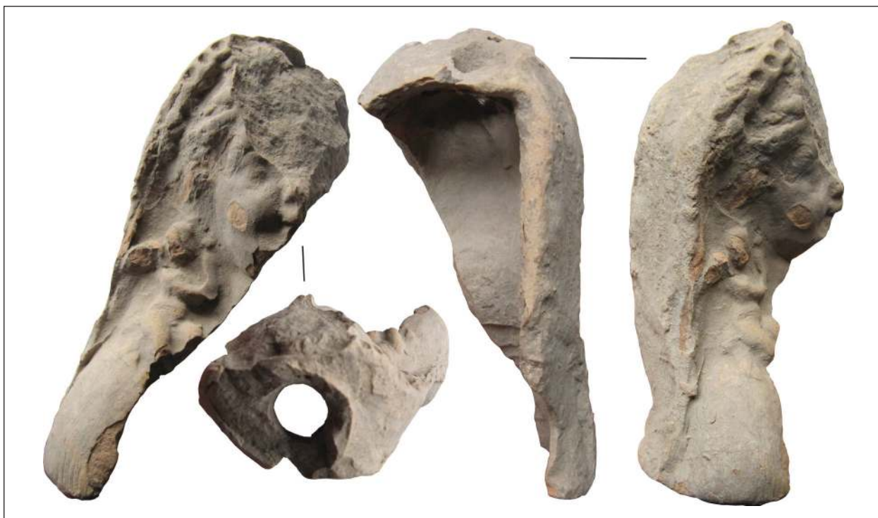
Рис. 4. Фрагмент погруддя-фіміатерія Афродіти (O-55/1958), розкопки О. І. Леві, О. М. Карасьова, Східний Теменос. НФ ІА НАНУ

ційний стан зображуваних тощо не є визначальним для віднесення фігурок до того чи іншого культу. Та ж Афродіта, зображена одним майстром юною і тендітною, в іншого постає ледь не огрядною. На погруддях-фіміатеріях богиня постає усміхненою повновидою жінкою, з важкими повіками, округлими випуклими щоками, повною шиею, ледь розкритим ротом, більше вираженою верхньою губою, випнутим підборіддям. Крім Ольвії, таке лице, як на серії аналізованих