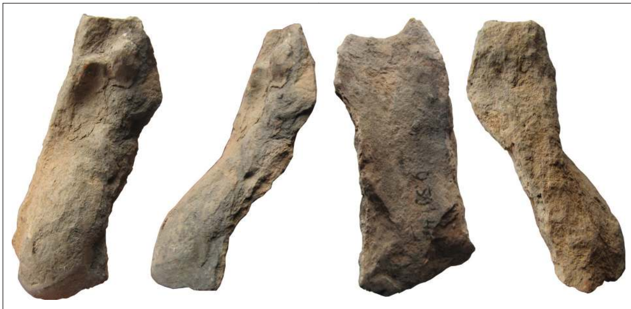
Рис. 3. Фрагмент погруддя-фіміатерія Афродіти (O-59/4341), розкопки О. І. Леві, О. М. Карасьова, Східний Теменос. НФ ІА НАНУ