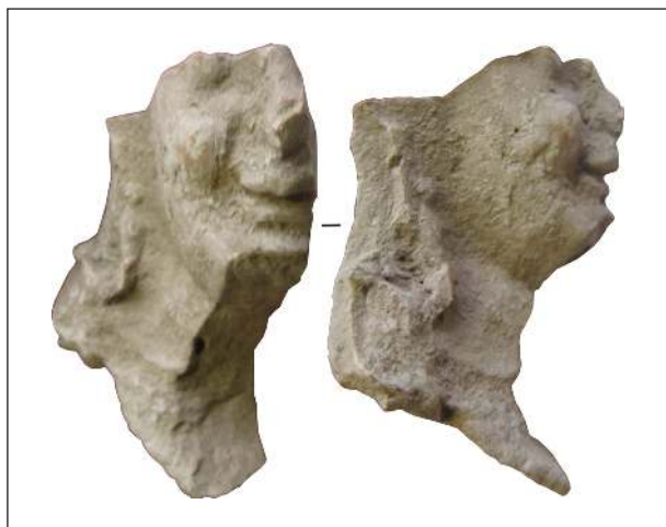
Рис. 7. Фрагмент погруддя-фіміатерія Афродіти (О-60/3373), розкопки О. І. Леві, О. М. Карасьова, Східний Теменос. НФ ІА НАНУ

копіюють одне одного, що уможливило припустити не лише той самий час виготовлення їх, а й руку одного коропласта чи його майстерні. Образ, змальований з однієї жінки, так сподобався майстрові, що він повторював його в різних фігурках, можливо й різних богинь. До виготовлених у формі півфігурних зображень додано ліпні деталі, а саме: листя і плоди, з яких створено вінок, традиційний для культу Діоніса. Так втілили образ учасниці діонісійського фіаса (рис. 10).