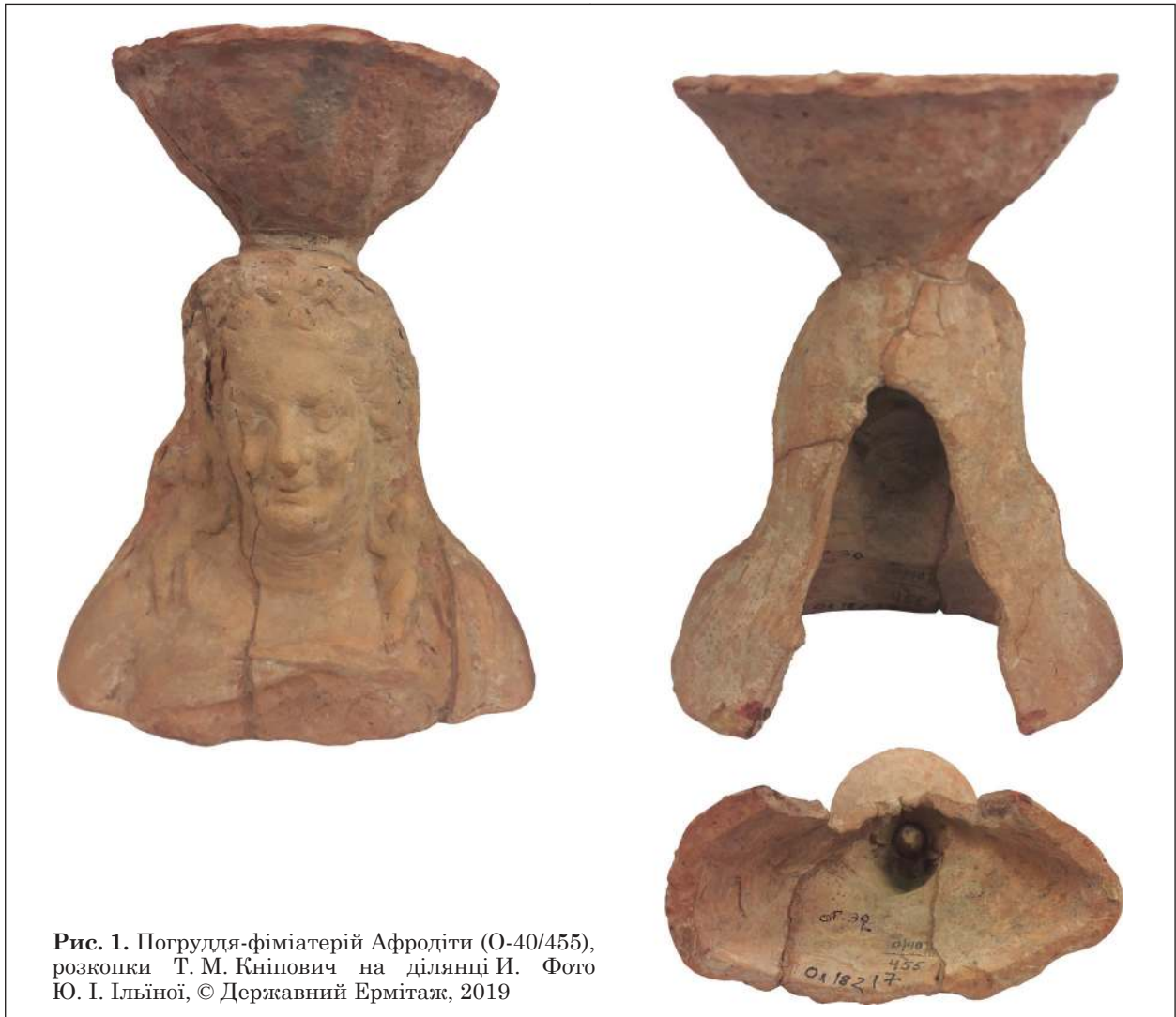
Рис. 1. Погруддя-фіміатерій Афродіти (О-40/455), розкопки Т. М. Кніпович на ділянці ІІ.

тероса — як у метелика. Образи Ерота і Гімероса, кохання і пристрасті, зазвичай нічим не відрізнялися між собою, через що в літературі зображення їх називають просто еротами.