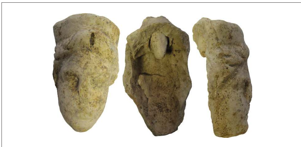
Рис. 14. Фрагмент погруддя-фіміатерія Афродіти (О-74/АГД/477), розкопки А. С. Русяєвої, ботрос на Західному Теменосі. НФ ІА НАНУ