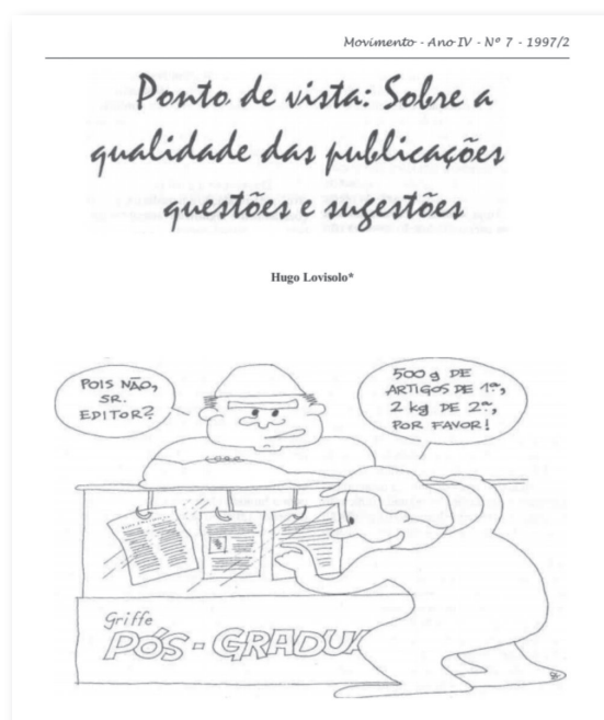
Figura 1 Qualidade das publicações.

laterais, 7 fizeram parte do layout gráfico que visava seduzir um público diversificado para a leitura da revista. Abaixo pode ser visualizado um exemplo do design dos primeiros números da Movimento: trata-se da primeira página de um artigo nela publicado na sua sétima edição, em 1997 (fig. 1).