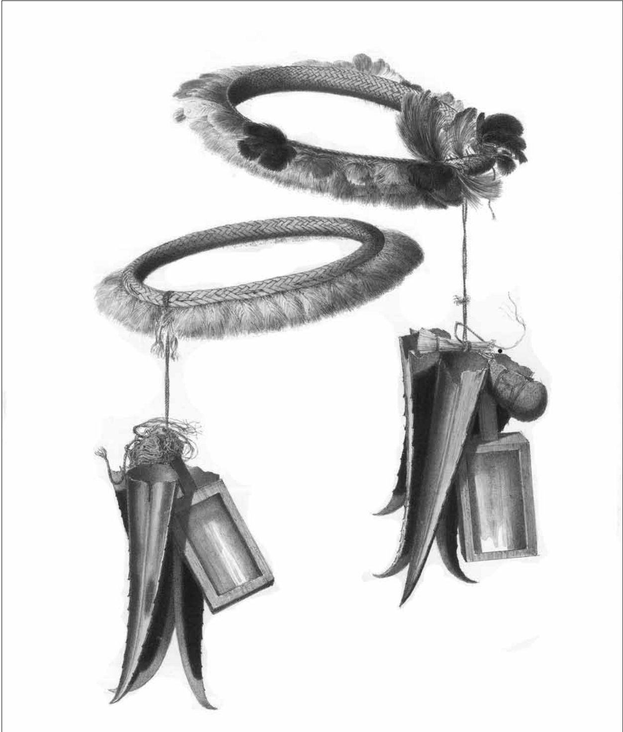
Figura1. Litografia de Fleiuss Irmãos e Linde. Acangatar (adorno em forma de anel para cabeça) com espelhos e bico de tucanos dos "Jauás" (Yaguas), segundo Gonçalves Dias. Esse grupo ainda habita a região de Loreto, no Peru.