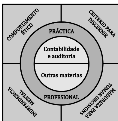
Figura 1.- Formación e competencias do auditor

Na figura 1 represéntase a relación entre coñecementos e competencias, aplicados ao caso concreto do auditor. Os coñecementos achégaos, principalmente, o currículo académico, as habilidades teñen que ver con saber aplicar estes coñecementos en situacións reais, que veñen proporcionadas pola práctica profesional previa á autorización para exercer.