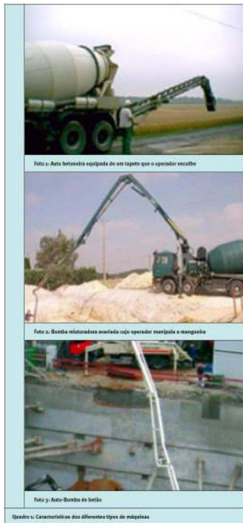
Quadro 1 : Características dos diferentes tipos de máquinas

estaleiro durante pelo menos meio-dia. São alimentadas com betão por máquinas equipadas de cubas que fazem o percurso entre a central e o estaleiro.