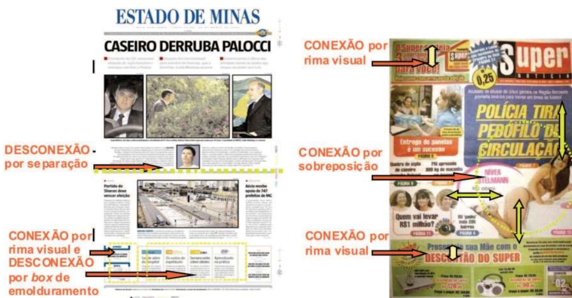
Figura 5 – Primeira página dos jornais Estado de Minas e Super Notícia – análise sob o enfoque dos recursos de emoldramento.

Já no Super , há uma conexão entre os elementos, os quais não compõem necessariamente uma unidade de informação, mas sim um “mix” de variedades apresentadas ao leitor. Nesse sentido, vale assinalar o efeito de conexão configurado pela representação de Nívea Stelmann, em que parte de sua cabeça “invade” o domínio da chamada “Polícia tira pedófilo de circulação”. A imagem da atriz parece concentrar a atenção do leitor em um primeiro momento para, em seguida, distribuí-la para as chamadas com as quais estabelece conexão, conforme sublinhado na análise dos recursos de saliência.