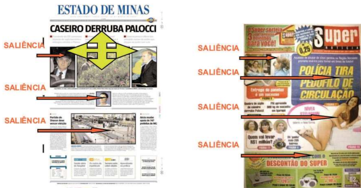
Figura 4 – Primeira página dos jornais Estado de Minas e Super Notícia – análise sob o enfoque dos recursos de saliência.