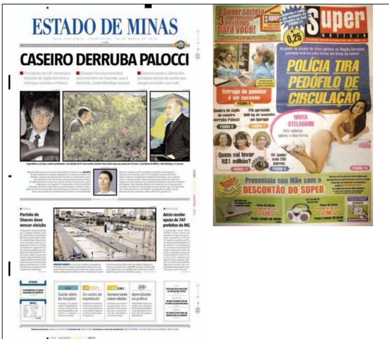
Figura 2 – Primeira página das edições de 28/03/06 dos jornais Estado de Minas e Super Notícia.

Selecionado aleatoriamente para fins de estudo-piloto, o corpus é composto pela primeira página de dois jornais mineiros: Estado de Minas (formato padrão) e Super Notícia (formato tabloide), edições de 28 de março de 2006, a fim de verificar as tendências destes jornais no que tange à construção de significados sociais em suas respectivas primeiras páginas.