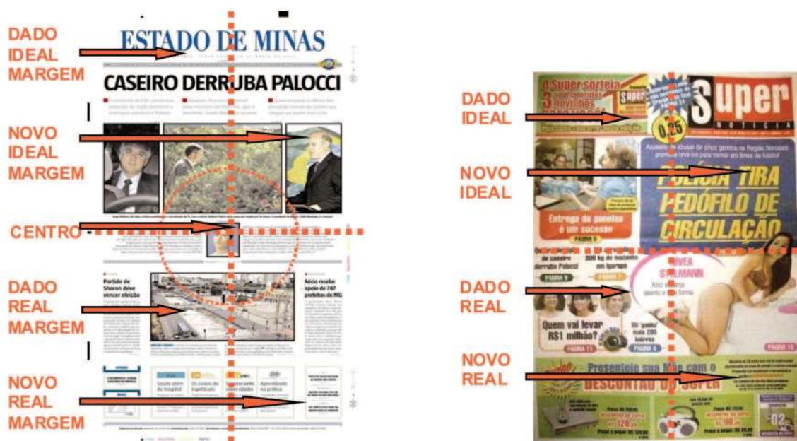
Figura 3 – Primeira página dos jornais Estado de Minas e Super Notícias – análise sob o enfoque do valor informacional.

No campo do Real, seção inferior da página, predominam pequenos textos de diferentes editorias (cultura, saúde, voluntariado, economia, ciência), excetuando-se a notícia sobre a cobertura do rio Arrudas, cuja representação aparece em posição central e em tamanho considerável. A obra faz parte do projeto Linha Verde, via expressa a ser construída pelo Executivo estadual, ligando o centro de Belo Horizonte ao Aeroporto Internacional de Confins. O “Boulevard Arrudas”, atuando como um dos braços deste projeto, visa promover a revitalização urbanística do centro da cidade, chamando, portanto, a atenção do leitor para as ações políticas de caráter local. Talvez a ênfase atribuída ao “Boulevard Arrudas” possa ser explicada pelo contexto histórico, visto que sua inauguração foi feita às vésperas da 47ª Reunião Mundial do BID, que trouxe para a cidade cerca de 7 mil banqueiros, investidores e administradores públicos.