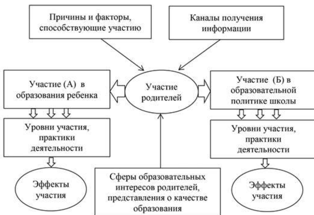
Рисунок 1 Обобщенная модель объекта исследования «Участие родителей в образовании ребенка и в образовательной политике школы»

Полученная в результате приведенных обобщений модель, представляющая объект исследования, схематично изображена на рисунке 1.