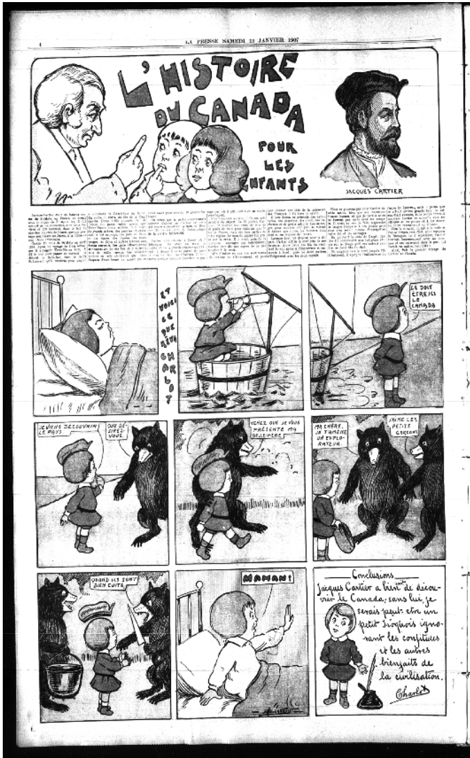
Albéric Bourgeois, « Le rêve de Charlot », La Presse , 19 janvier 1907, p. 4.