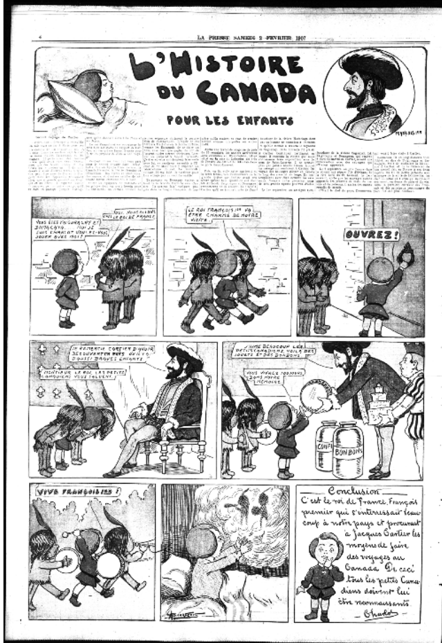
Albéric Bourgeois, « Le rêve de Charlot », La Presse , 2 février 1907, p. 4.