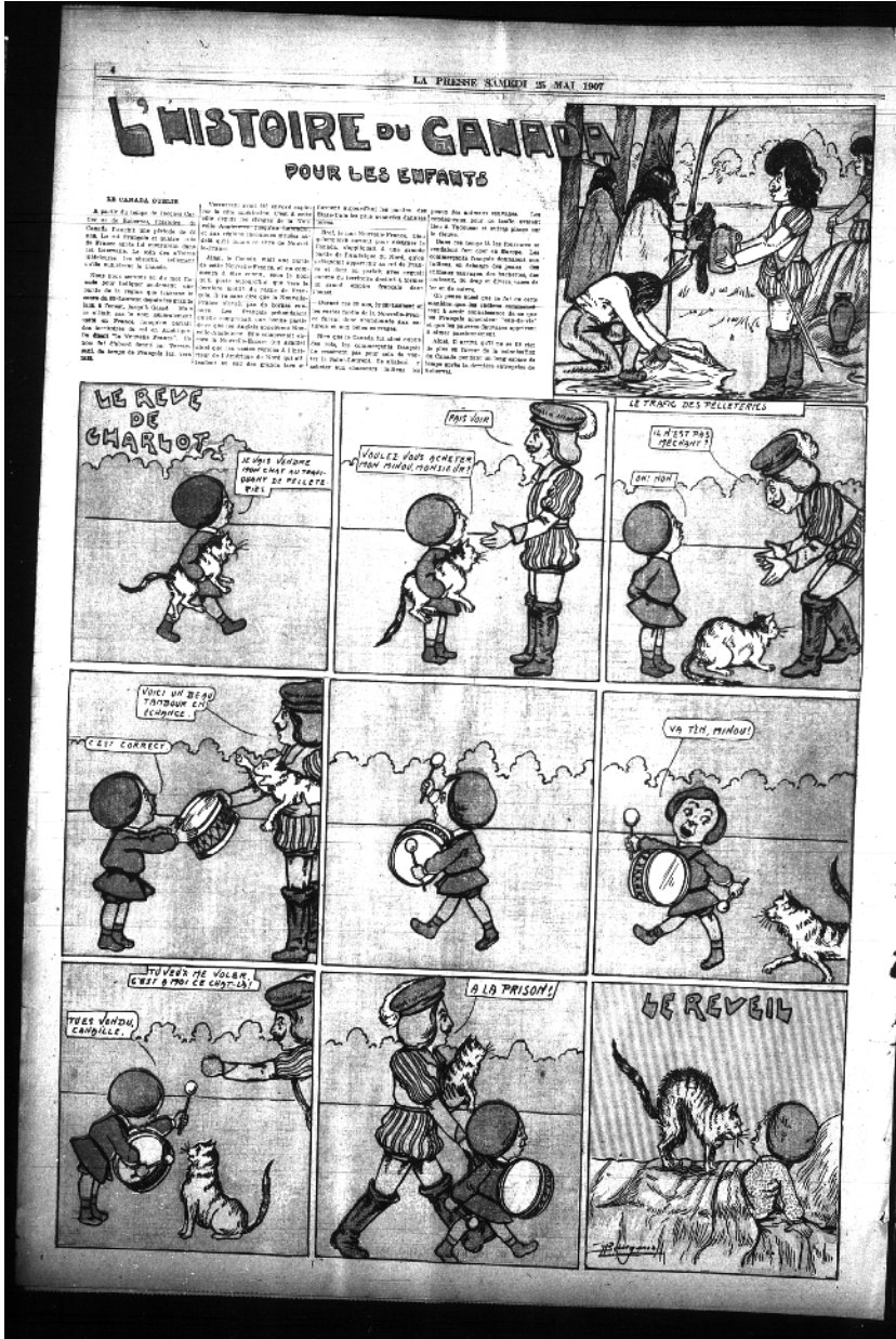
Albéric Bourgeois, « Le rêve de Charlotte », La Presse , 25 mai 1907, p. 4.

Le sujet le plus fréquent de la série porte sur les rapports tendus entre les Amérindiens et les Français et, plus précisément, sur les conflits sanglants avec les différentes nations iroquoises. Ces relations belliqueuses sont aussi rapportées