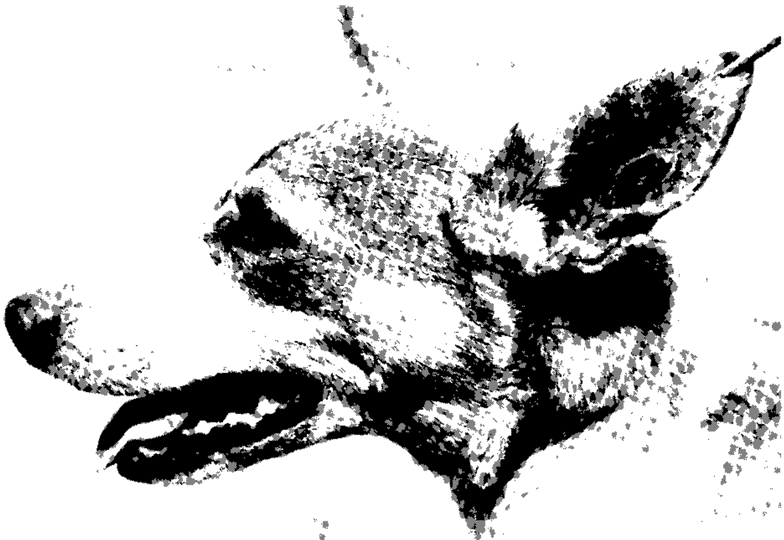
Fig. 4: cadela "mocinha" (CV-3), com lesão na face interna da orelha: localização mais frequentemente observada.

Os cães positivos foram acompanhados in natura durante dois anos. Ao final desse período havia ainda oito cães com lesões ativas. Dos 24 restantes, 11 foram retirados da área para estudos, nove morreram ou foram eliminados e quatro foram perdidos de controle. Não se observou cura espontânea de qualquer lesão durante o período de observação. Foi possível ainda observar o aparecimento de lesões nas mucosas de três cães que apresentavam inicialmente apenas a forma cutânea da doença.