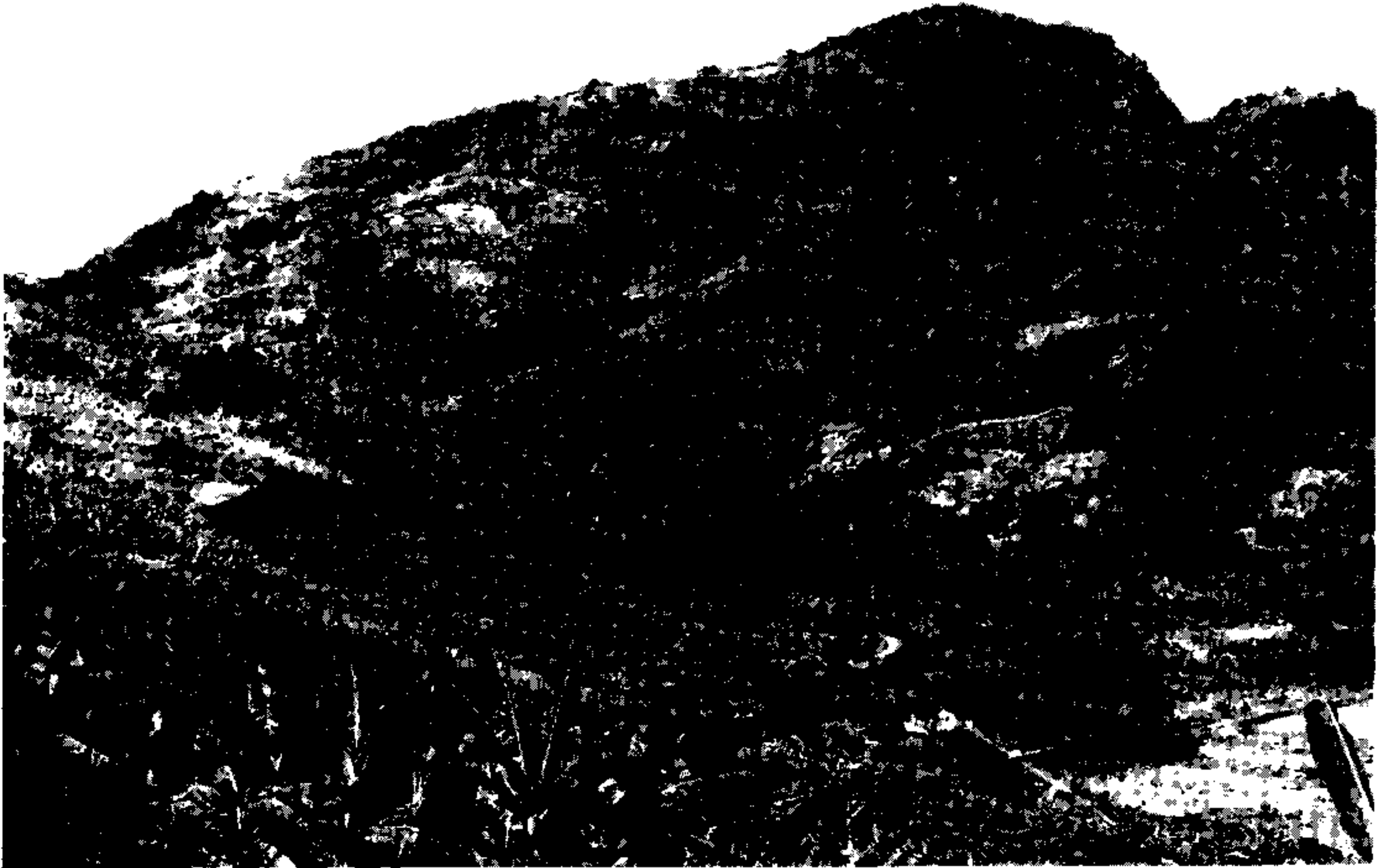
Fig. 2: vista parcial da localidade de Coacas, mostrando um vale onde estão instaladas 11 casas, em meio aos bananais. C - Pontos onde estão instaladas algumas das casas; B - Bananais; F - Floresta secundária.

um ou dois fragmentos das bordas das lesões, para confecção de esfregaços que foram fixados com metanol e corados pelo Giemsa. No exame microscópico das lâminas foram percorridos 1.600 campos antes de se considerar o resultado negativo. O mesmo fragmento utilizado na preparação dos esfregaços foi em seguida macerado em aparelho triturador, de vidro, juntamente com 1,5 ml de solução salina estéril a 0,85%, contendo penicilina e estreptomicina nas concentrações de 400U/ml e 80 \mu g/ml, respectivamente. A suspensão foi inoculada por via subcutânea no focinho de hamsters ( Cricetus auratus ), na dose de 0,4 a 0,7 ml cada, sendo utilizados dois hamsters para cada animal suspeito. Os hamsters foram observados durante 10 meses, sendo examinados no decorrer desse período quando apresentassem sinais da doença, ou no final do mesmo, em caso contrário.