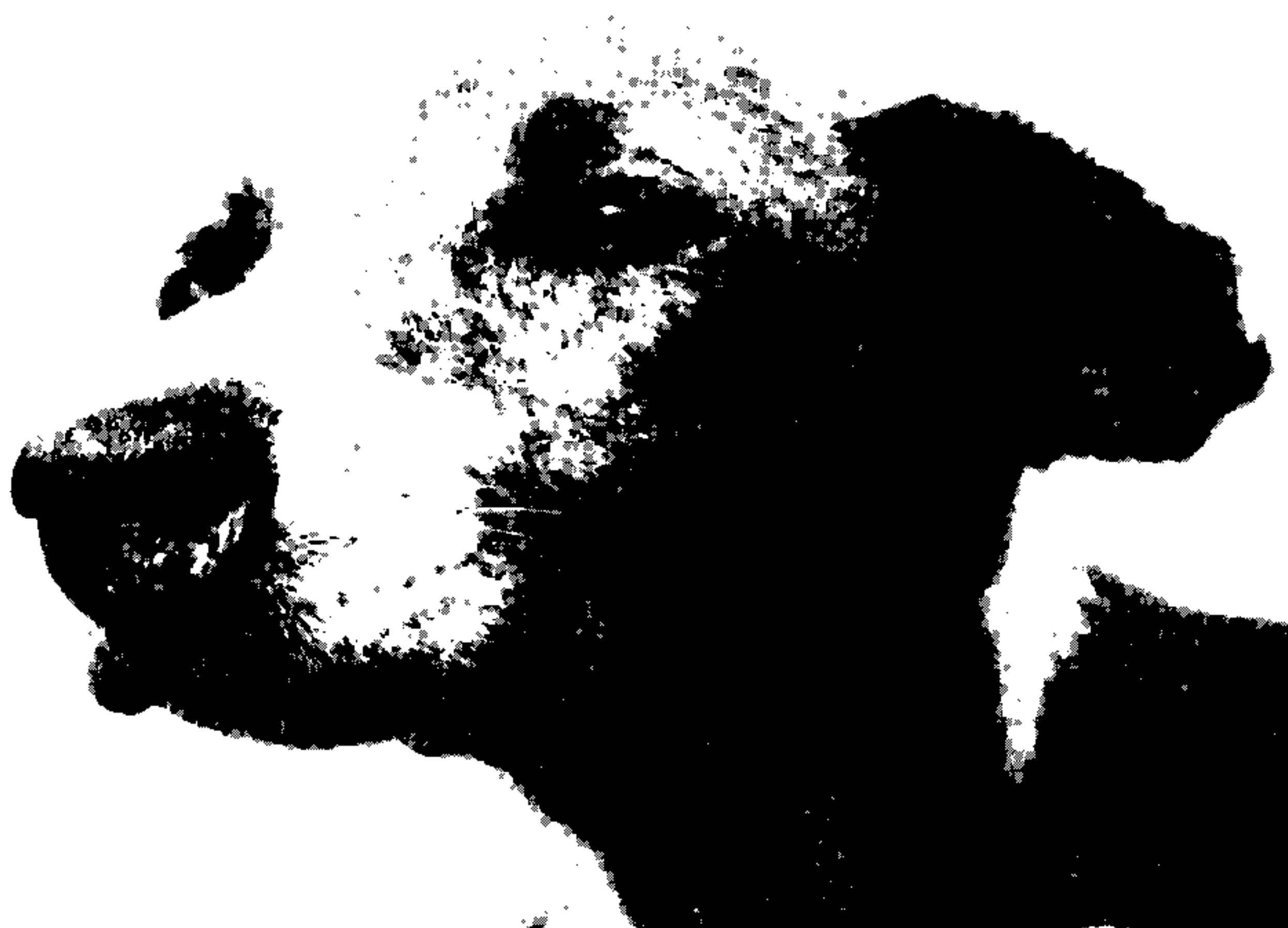
Fig. 3: cão "leão" (CV-23): úlcera leishmaniótica comprometendo a mucosa nasal.

Em 25 cães positivos a doença manifestava-se na forma cutânea e em quatro apareciam somente lesões de mucosas; nos três restantes havia associação das duas formas. O aspecto ulcerado foi observado em 30 cães (Figs. 3 e 4) enquanto que nos dois restantes a doença manifestava-se na forma de nódulos e área cicatricial, respectivamente.