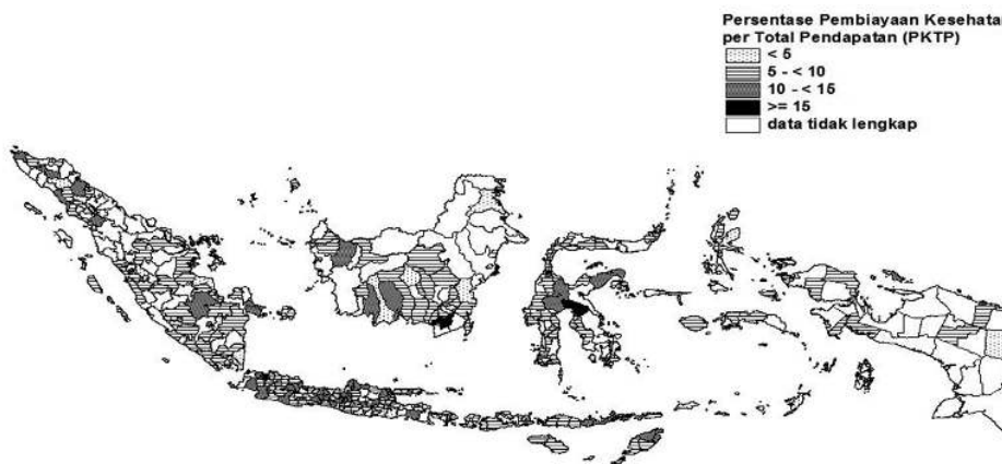
Gambar 3. Distribusi Pembiayaan Kesehatan per Total Pendapatan Kabupaten/Kota di Indonesia