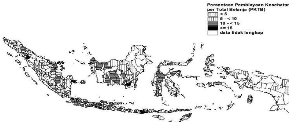
Gambar 4. Distribusi Pembiayaan Kesehatan per Total Belanja Kabupaten/Kota di Indonesia

PKTB pada Tabel 1, terlihat adanya kesenjangan yang besar antarkabupaten/kota. Berdasarkan variabel PADTP, rata-rata persentasenya yaitu 6,49%. Artinya ketergantungan kabupaten/kota terhadap dana dari pusat maupun provinsi sangat besar. Rentang yang besar pada persentase PADTP antara kabupaten/kota memperlihatkan kesenjangan kemampuan dalam membiayai daerahnya. Hasil tersebut serupa dengan hasil penelitian Heywood dan Harahap (2009) yang menemukan bahwa pendapatan pemerintah daerah bergantung lebih dari