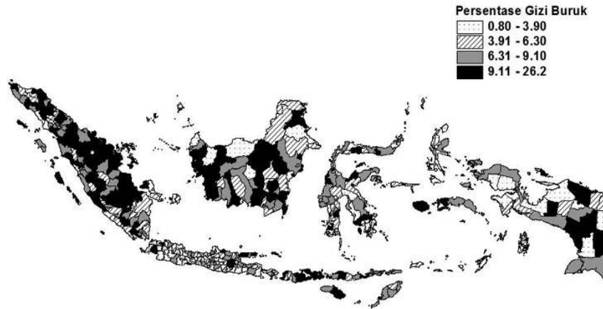
Gambar 2. Distribusi Prevalensi Gizi Buruk Kabupaten/Kota di Indonesia