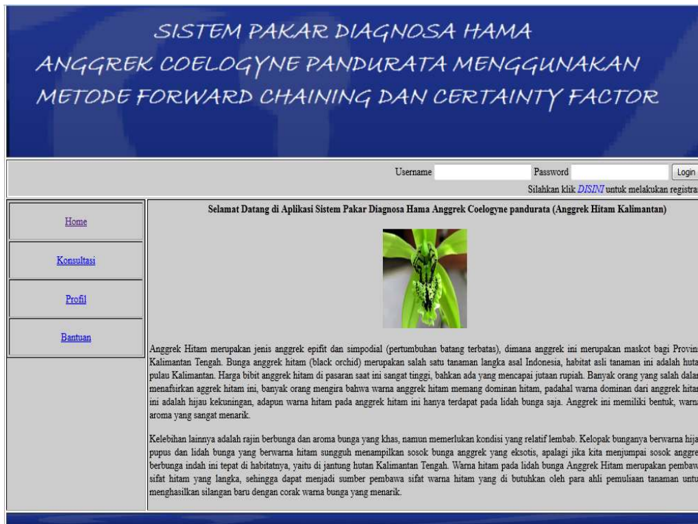
Gambar 4. Tampilan awal sistem pakar

Untuk dapat melakukan proses diagnosa, pengguna dapat memilih menu Konsultasi terlebih dahulu pada Gambar 5.