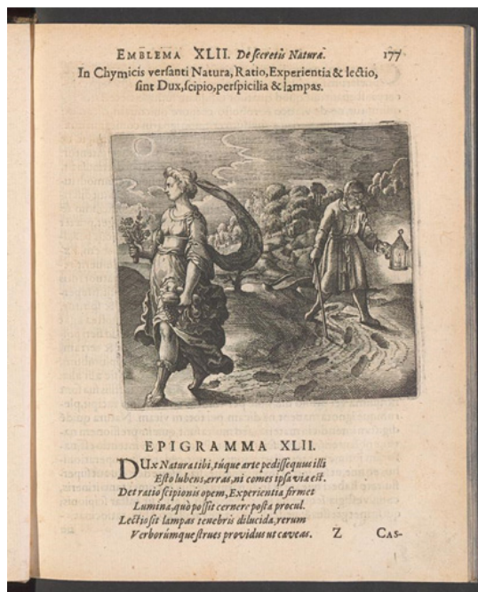
Figura 3. Michael Maier. La fuga de Atalanta, emblema XLII.

ciñe únicamente a las supuestas operaciones químicas, sino que tiene implicaciones filosóficas, cosmológicas o metafísicas.