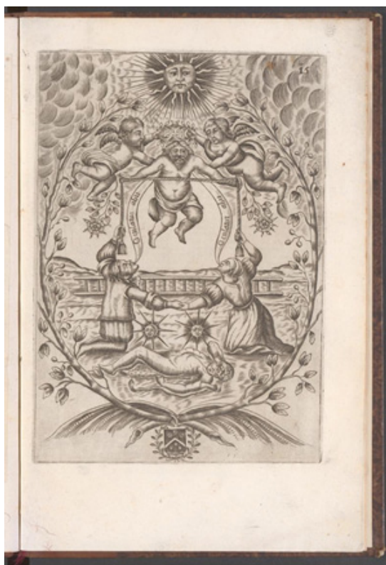
Figura 5. Altus, Mutus Liber , 1677.

Con el grabado que presentamos concluye la serie; tiene una relación directa con el primero, en el cual se observa a unos ángeles que bajan por una escalera de Jacob, y que pretende transmitir la idea de la alquimia como forma de arte teúrgica que pone en relación con lo divino. En este último grabado la escalera está caída al dejar de ser necesaria, ya que el adepto glorificado posee la visión directa. La pareja protagonista de la serie ha alcanzado el estado de perfección, ejecutado visualmente según el motivo iconográfico clásico de la ciencia de Hermes: con una referencia al andrógino —la conjunción del sol y de la luna—, y el adepto espiritualizado, el cadáver —Hércules, lo material— en el suelo. Vemos la apoteosis del ser perfecto, coronado por dos ángeles (Klossowski de Rola, 2004, p. 284).