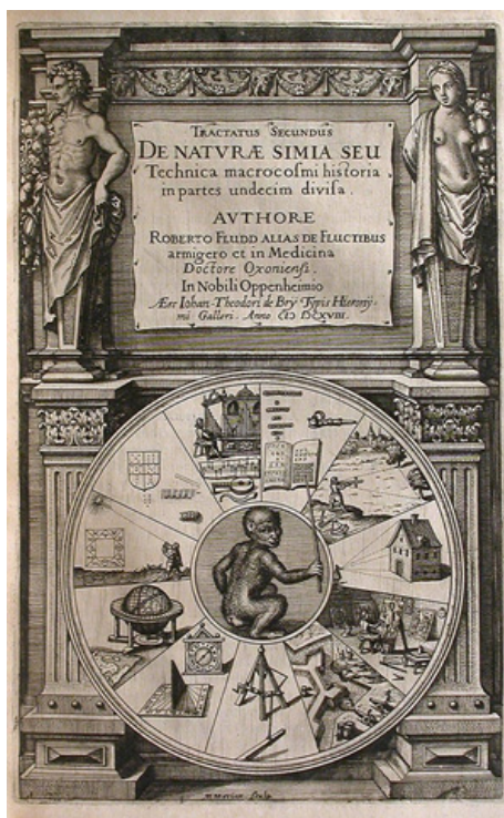
Figura 2. Robert Fludd, grabado de M. Merian, 1624.

A continuación expondremos brevemente algunos ejemplos del siglo XVII del desarrollo de dicho lenguaje jeroglífico en los libros de emblemas hermético-alquímicos. Esa investigación se halla plenamente en la obra de Robert Fludd Utriusque Cosmi, Maioris scilicet et Minoris, metaphysica, physica, atque technica Historia ; el hermético antecede cada capítulo de una explicación visual de lo que seguirá mediante un grabado; este funciona como índice visual y como resumen de la esencia; Fludd colocó cuatro de esa manera, uno en la primera página, otro en un desplegable justo a continuación, ambos grabados como resúmenes de todo aquello que existe y de cuál es su orden; luego coloca otro delante del primer tratado, sobre lo cósmico, para más adelante añadir otro antecediendo el segundo tratado, que versa sobre las artes vinculadas al dominio de la aritmética.