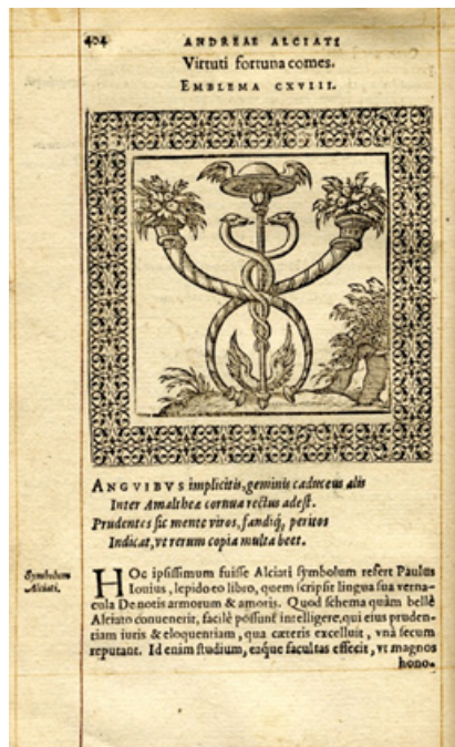
Figura 1. Alciato, emblema CXVIII: La fortuna es compañera de la virtud.

En él, Alciato unió los atributos de Mercurio —caduceo, alas en el sombrero y en los pies— con las cornucopias de la cabra Amaltea. El sentido es que las personas con sabiduría, mente poderosa y facultada para la hermenéutica, personas dotadas de elocuencia, alcanzarán los cuernos de la abundancia de la Fortuna, es decir, se verán favorecidos por ella, como enfatiza en la glosa en latín (Alciato, 1993, pp. 156-157). La elocuencia era uno de los atributos asociados tradicionalmente a Hermes.