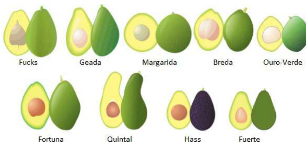
Figura 2. Principais variedades de abacate comercializadas no Brasil.