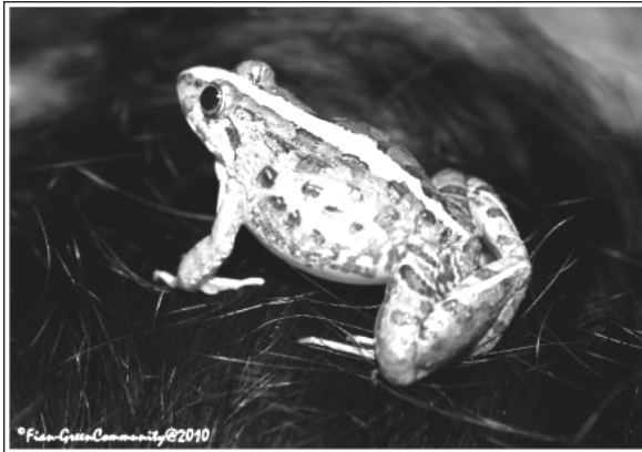
Fejervarya limnocharis (Katak Tegalan)