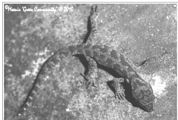
Cyrtodactylus marmoratus (Cicak Hutan)