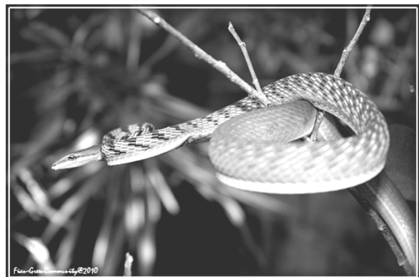
Ahaetulla prasin (Ular Pohon Hijau)