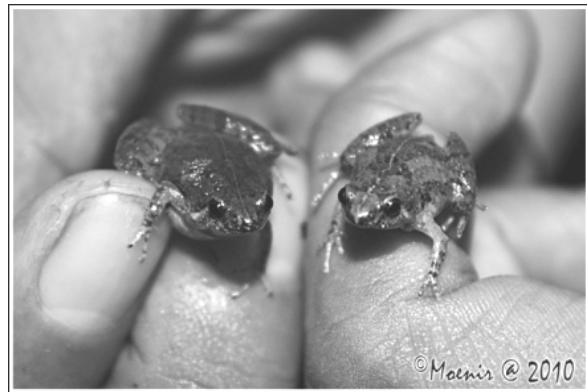
Microhyla palmipes (Percil Berselaput)