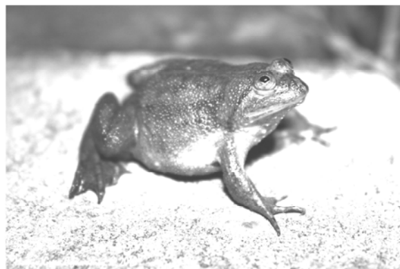
Occidozyga lima (bancet hijau)