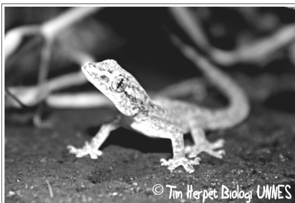
Hemidactylus frenatus (Cicak Pohon)