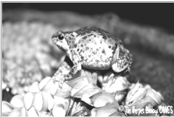
Kaloula baleata (Belentuk)