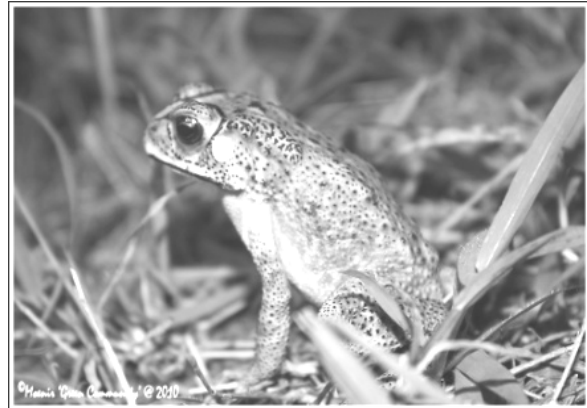
Bufo melanostictus (Kodok)