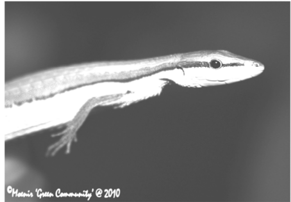
Tachydromus sexlineatus (Kadal Pari)