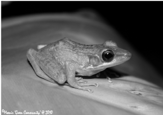
Rana calchonata (Kongkang Kolam)