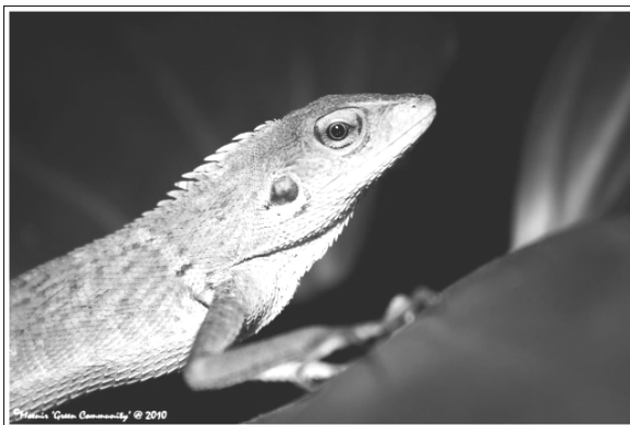
Bronchocela cristatella (Bunglon)