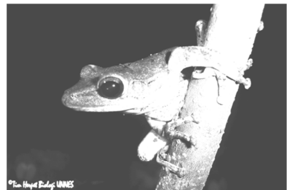
Polypedates leucomystax (katak pohon)