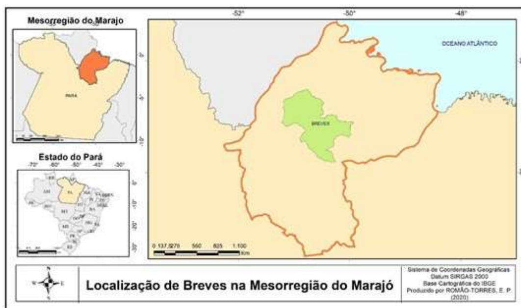
Figura 1: Localização do município de Breves no arquipélago do Marajó.

A mesorregião do Marajó, está localizada no estado do Pará e compreende municípios fluviais, que se localizam integralmente no arquipélago e municípios continentais (Brasil, 2007), ligados pelos rios e furos, com características ambientais, socioeconômicas e culturais semelhantes (Figura 1).