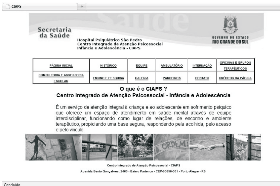
Figura 2: Página inicial do Site do CIAPS

O Hospital Psiquiátrico São Pedro (HPSP) possui uma página institucional hospedada dentro do website da Secretaria Estadual de Saúde do Rio Grande do Sul (SES). A coordenação do CIAPS, então, iniciou contatos com a SES a fim de utilizar esse espaço. Participamos de uma reunião com o responsável pelo site do HPSP, que informou que a página do CIAPS não poderia ser publicada tal como havia sido produzida, já que o site da SES possuía uma pré-configuração de alguns elementos. Acertou-se, assim, que a página seria publicada seguindo o formato padrão, mas com conteúdo produzido pela equipe.