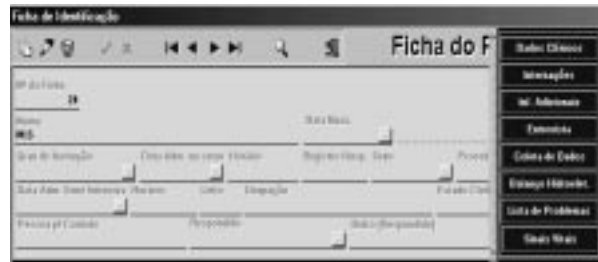
Figura 1 – Módulo Ficha Geral do Paciente

Após a inserção de todos os campos é obrigatório Salvar os dados cadastrados.