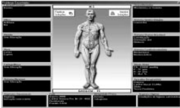
Figura 3 – Módulo Lista de Problemas

O módulo Lista de Problemas (Figura 3) apresenta um esquema representativo do corpo humano, dividido em seis partições, com um dispositivo para o usuário acionar cada uma dessas partições e visualizar os respectivos dados. O módulo Lista de Problemas também configura interface com o módulo Prescrição de Enfermagem . O usuário selecionará um dado visualizado no módulo Lista de Problemas e com um duplo toque no dispositivo de entrada ( mouse ) sobre esse, será disponibilizado o módulo Prescrição de Enfermagem .