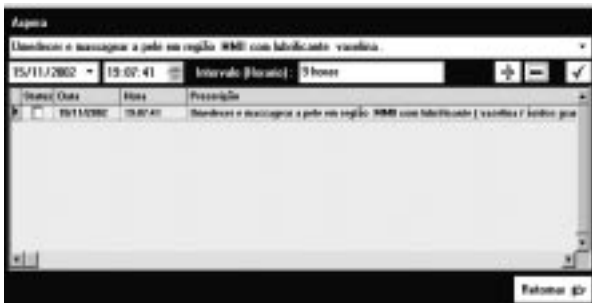
Figura 4 – Módulo Prescrição de Enfermagem

O módulo Prescrição de Enfermagem (Figura 4) permite que o usuário visualize o sinal/sintoma escolhido para efetuar a prescrição de enfermagem e também poderá decidir se utilizará a base de prescrições já disponível no banco de dados, ou se realizará alterações, ou digitará sua própria prescrição. O usuário poderá visualizar e imprimir todas as prescrições elaboradas com um toque no dispositivo de entrada ( mouse ) em cima do ícone "Imprimir Soluções", localizado no módulo Lista de Problemas . O usuário também terá disponibilizada a opção de copiar a prescrição de uma data para outra, por meio do ícone "Replicar Soluções" que se localiza no módulo Lista de Problemas .