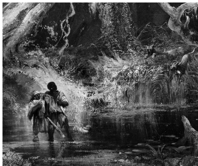
Figura 2. Detalle de Slave Hunt or Slaves Escaping Through the Swamp , Óleo en tela, 85,73 x 111,76 cm. Philbrook Museum of Art, Tulsa, Oklahoma, Estados Unidos.

gilantes, aparentan ser la entrada al pantano), se advierte vagamente la presencia diminuta de dos rancheadores (figura 1). Apenas deslindados, sus sombras también se fusionan con el paisaje, y se requiere un esfuerzo superior de la mirada para detectar su presencia en el cuadro. Miran pero no pueden ser fácilmente vistos. Vienen de lejos siguiendo la pista de sus perros, dispuestos a completar el acto de la cacería.