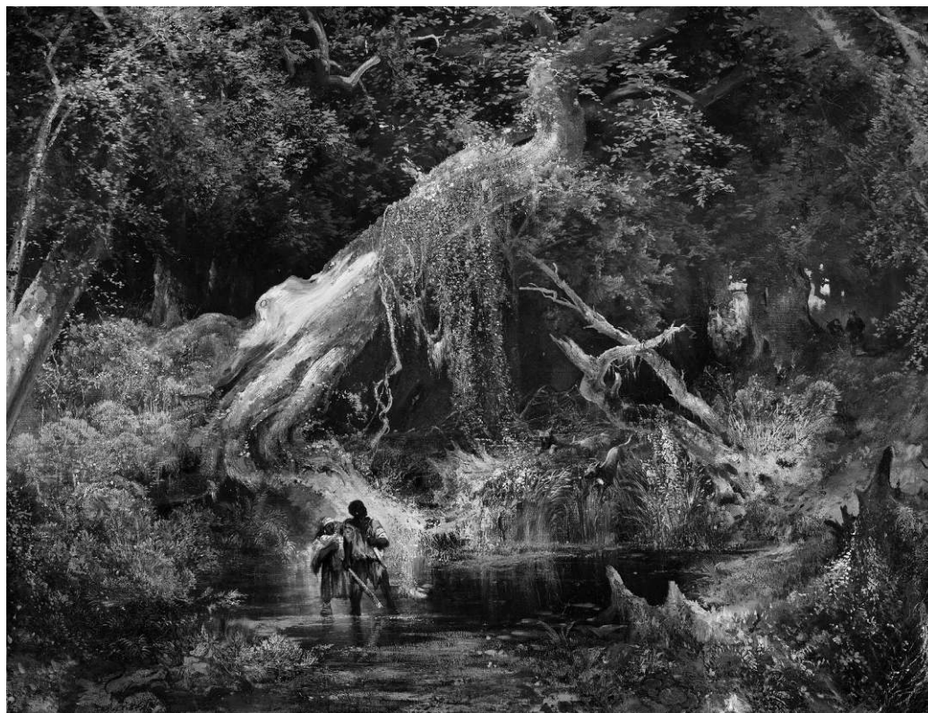
Figura 1. Thomas Moran. 1862. Slave Hunt or Slaves Escaping Through the Swamp [Cacería de esclavos o Esclavos que escapan por el Pantano Lóbrego], Óleo en tela, 85,73 x 111,76 cm. Philbrook Museum of Art, Tulsa, Oklahoma, Estados Unidos.

Nacido en Inglaterra pero criado en Filadelfia, Moran fue parte de la reconocida Hudson River School (Escuela del Río Hudson), el movimiento pictórico que hacia mediados del siglo XIX se dedicó a construir una imagen de la nación norteamericana por medio del paisajismo. Su obra más conocida es la serie de pinturas sobre el parque de Yellowstone, parte del material que motivó al Congreso a declararlo patrimonio y parque nacional en 1872. De corte romántico, los paisajes de Moran participan de la estética de lo sublime, entendida aquí tanto en cuanto a la conceptualización hecha por Burke como en un sentido kantiano: movilizan una retórica visual dirigida, en algunos casos, a sobrecoger por su imponente majestuosidad, produciendo una suspensión de la razón y los sentidos mediante la experiencia del horror. Espacios casi siempre vaciados de presencia humana, la vasta obra de Moran comprende paisajes luminosos y abiertos, llamados a inducir la experiencia temerosa del infinito, pero en no pocas ocasiones se detiene en zonas lúgubres, cerradas y tenebrosas, tales como los pantanos que tan detalladamente ocuparon su imaginación (Anderson 1997; Wilkins 1998).