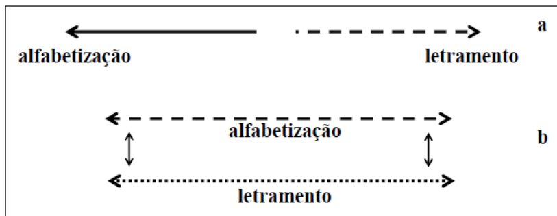
Figura 1. Compreensões da alfabetização e do letramento