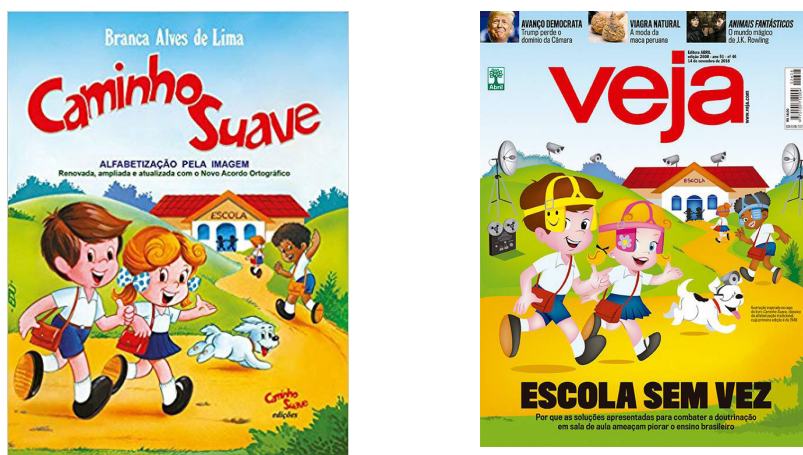
Figura 2. Ensino tradicional e anunciado

Em pesquisa desenvolvida a partir de contribuições da Linguística Textual, Massini-Cagliari (2005) mostra semelhanças entre textos desse tipo e os primeiros escritos de crianças alfabetizadas com cartilhas, diferentemente do constatado nas produções escritas dos aprendizes que tiveram acesso, no processo de alfabetização, a textos produzidos em contextos outros que não o escolar. Essas últimas revelavam maior conhecimento de mecanismos de textualidade por parte dos pequenos autores. Essa pesquisa realça o argumento de que os desafios da alfabetização vão além das escolhas metodológicas e que os cursos de formação não podem abrir mão da educação linguística das alfabetizadoras.